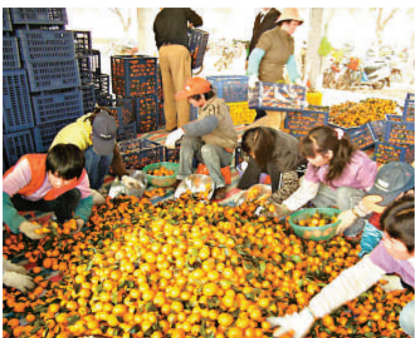
廣東郁南興建「兩廣農產品批發市場」助果農廣開銷路，圖為果農們分揀沙糖桔現場