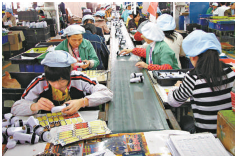
東莞樟木頭鎮的港資安泰玩具廠員工正在車間生產

【本報記者黃仰鵬東莞二十二日電】即將來臨的公元2009年，對大多數珠三角中小企業而言，卻是一個非同尋常的年關。而對於諸多「等單下鍋」的東莞港資玩具廠商來說，今年聖誕節是他們在大陸創業以來前景最為暗淡的聖誕節。有東莞港商表示，時下金融海嘯令大陸港商頻頻聚首，謀劃下年的應對之策，不少港企「自求多福」的同時，也期盼地方政府出台的幫扶政策和措施能盡快落到實處。