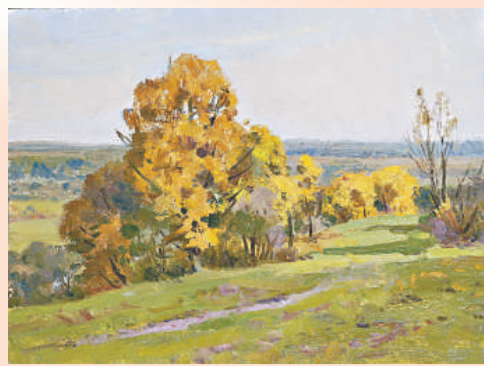
維克多《秋天的風景》