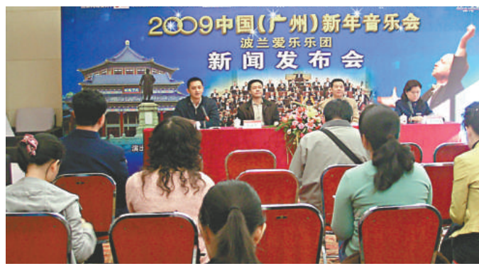
廣州新聞發布會表示，波蘭愛樂樂團將為當地新年音樂會擔綱演出