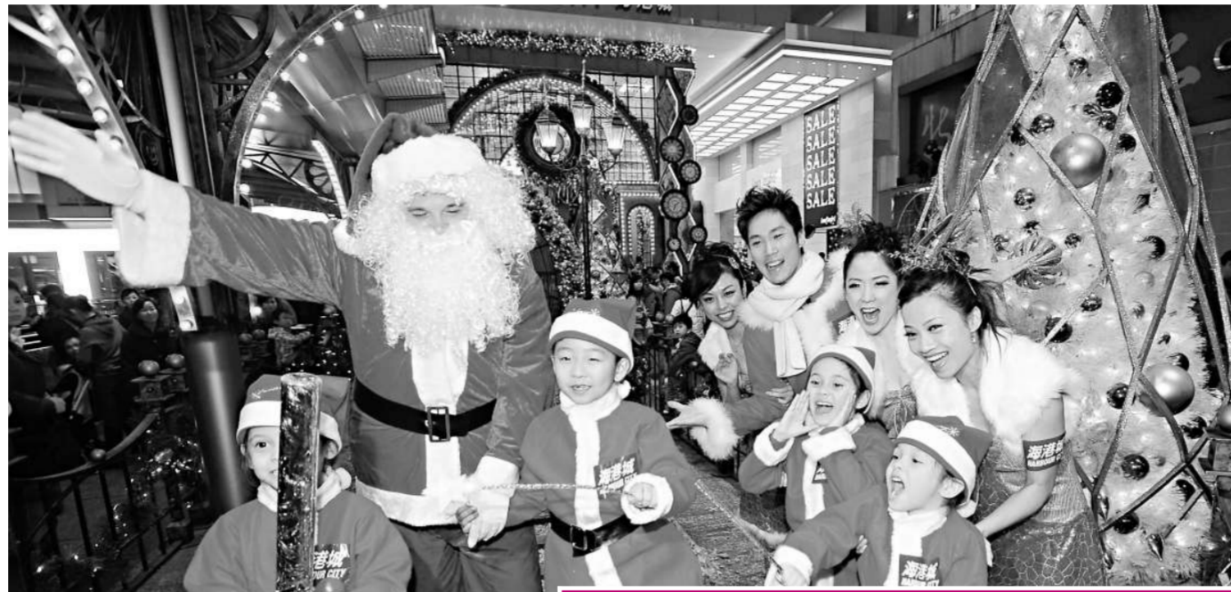
◀今晚平安夜有商場舉辦倒數活動，並將請來聖誕老人向小朋友大派糖果，與市民一起迎接聖誕節

另外，因應市民外出需要，港鐵今天將全線通宵行駛，城巴及新巴分別有十五條及十二條路線通宵行駛，而新渡輪及山頂纜車亦將延長服務時間。