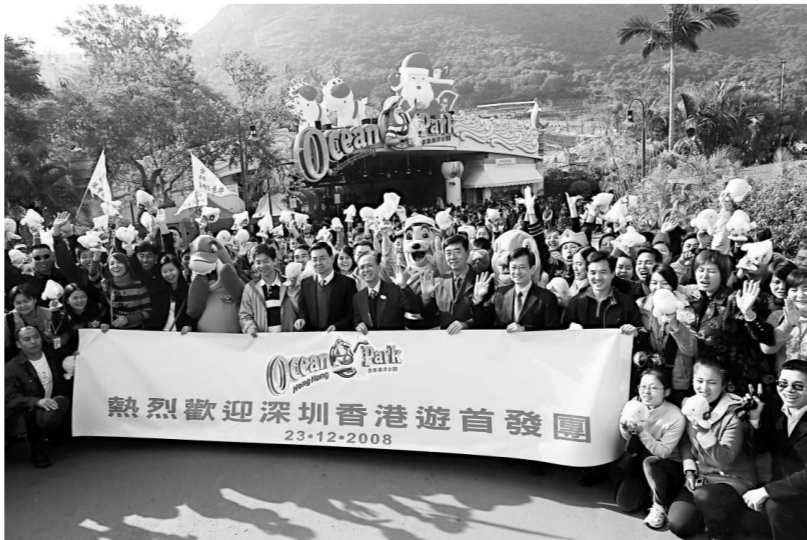
首個深圳外省居民定點旅行團昨日到香港海洋公園遊覽

據悉，今次各運轉公司在皇崗、深圳灣、文錦渡和沙頭角口岸每日增加過境巴士配額分別為280、50、45、60班次。同時，預料節日期間各口岸的旅客、車輛流量將大幅增長，深圳邊檢總站擬提前評估把握客流高峰時段，提前加開通道，並與港方口岸查驗單位的信息互通。