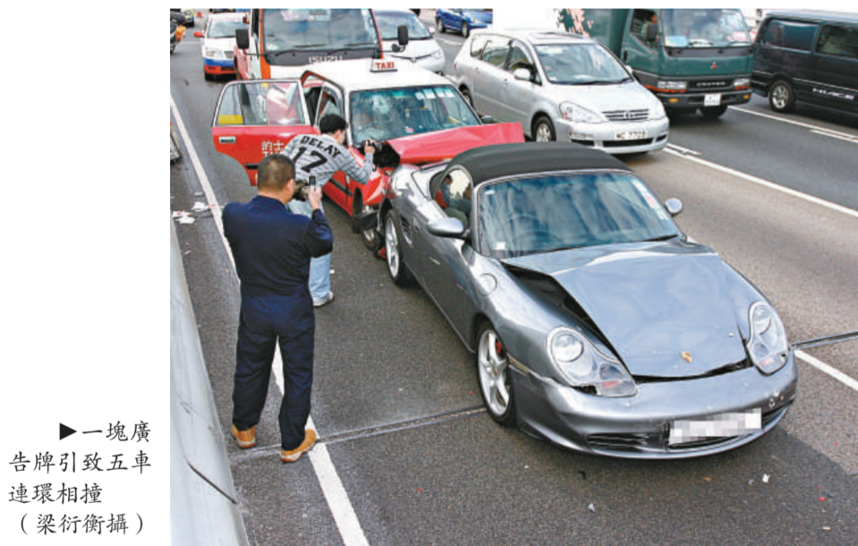
▲一塊廣告牌引致五車連環相撞