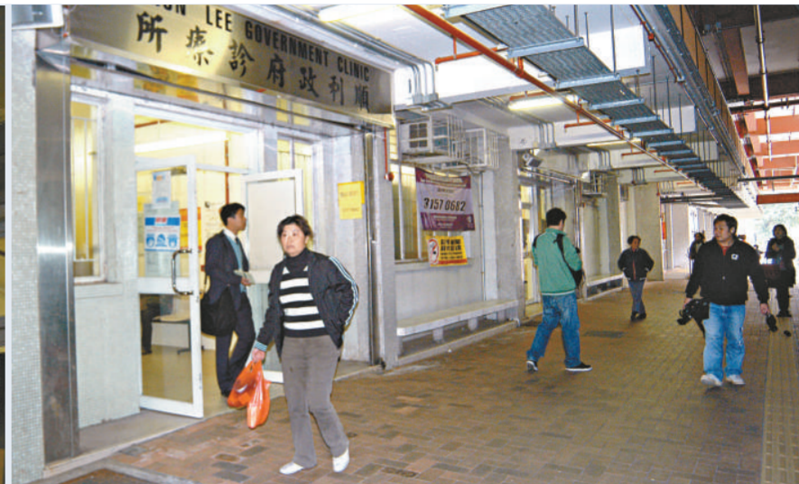
▲順利邨政府診所外昨天有老翁病發暈倒 ▼診所昨天照常為街坊提供診症服務