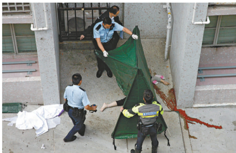
▲警員將膠布遮蓋老婦的屍體

警方封鎖現場調查，在走廊檢獲死者所穿拖鞋及木梳，在其身上發現有千餘元現金，死者兒子和媳婦接獲通知，即時趕返現場，兒子一度撫屍傷心痛哭。有人悲慟表示，婆婆過往曾被虐待，想不到事件會變成命案。警方事後將死者男孫帶署助查。