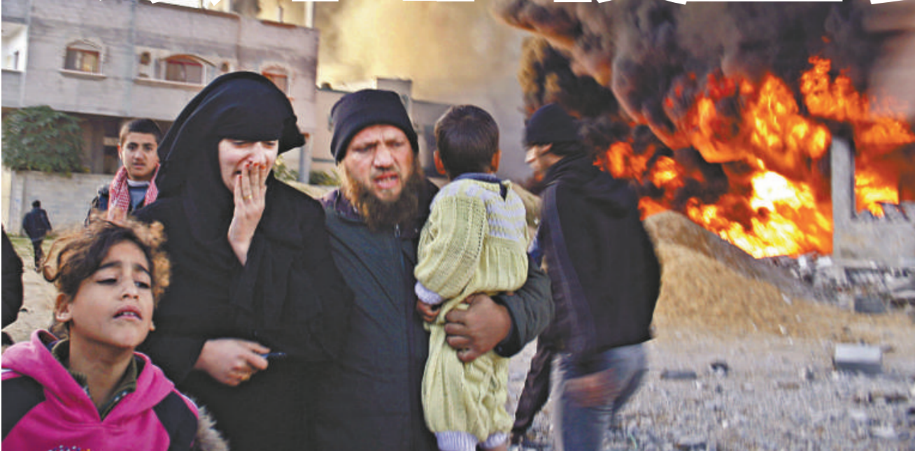
一個巴勒斯坦家庭在躲避戰火

【本報訊】綜合外電加沙城二十八日消息：以色列戰機二十八日繼續向加沙投擲炸彈和發射導彈，受襲的包括一個重要的安全機構、清真寺、電視台以及加沙地帶多個其他目標。