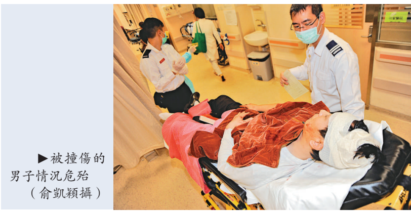
▶被撞傷的男子情況危殆

仰藥婦人名吳×君（三十六歲），與丈夫育有三名兒子。據悉，有人嗜賭成性，日前再登船「搏殺」，但有輸無贏，返回房間寫遺書吞下數十粒安眠藥自殺。至昨日下午三時許，職員巡房時拍門無人應，開門後見有人昏迷床上，於是報警。當賭船抵尖沙咀海港城碼頭，警員登船調查，帶同事主手袋等物送院。