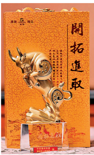
惠州向每一位與會者贈送《開荒牛》工藝品