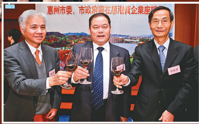
右起：中聯辦副主任黎桂康、惠州市委書記黃業斌、旭日集團董事長楊釗

出席會議的包括中聯辦副主任周俊明、黎桂康，社團部聯絡部部長郭鐵生，協調部部長王永樂，九龍工作部部長林武，中聯辦副主任，新界工作部部長陳卓以及全國政協委員、香港惠州社團聯合總會主席、香港旭日集團董事長楊釗，惠州市政協委員、特區行政會議成員、金山工業集團有限公司主席兼總裁羅仲榮，惠州市政協委員、中建電訊集團有限公司行政總裁兼主席麥紹棠，惠州市榮譽市民、香港廣東社團總會榮譽會長、香港亞倫國際集團主席張倫，河北省政協委員、旭日集團副董事長兼總經理楊勳等一百多人。