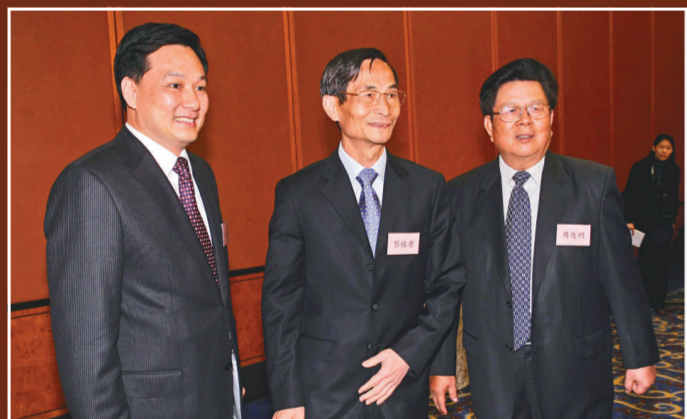
右起：中聯辦副主任周俊明、黎桂康與九龍工作部部長林武出席座談會

對我市重點外資企業實行客戶經理服務制度，並指定專業人員擔任客戶經理，派發客戶聯繫卡，實行「點對點」的溝通服務。