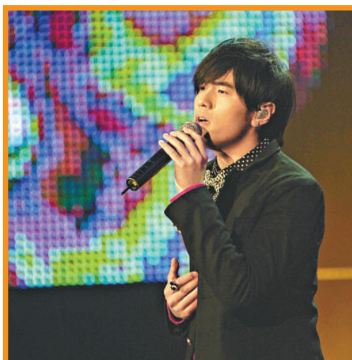
周杰倫在咪咕匯獻唱