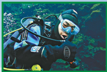
▲小齊在冰島潛水拍旅遊特輯 ▶小齊仔細觀賞冰湖上的冰塊

期間，敏之想起昔日做模特兒的歲月，感到現在的新晉模特兒非常幸福，不論機會及收入都比她當年多，不過敏之仍然很懷念當年模特兒的生涯。她道：「以前做模特兒好辛苦，而且要求非常嚴格，身型狀態都要保持最高水準，要付出好多努力，但當年模特兒彼此之間卻好團結，大家互相支持，圈內氣氛非常友好，所以現在都會和昔日的模特兒朋友聯絡。」