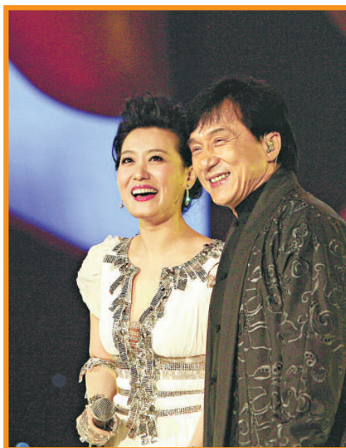
成龍與譚晶言談甚歡