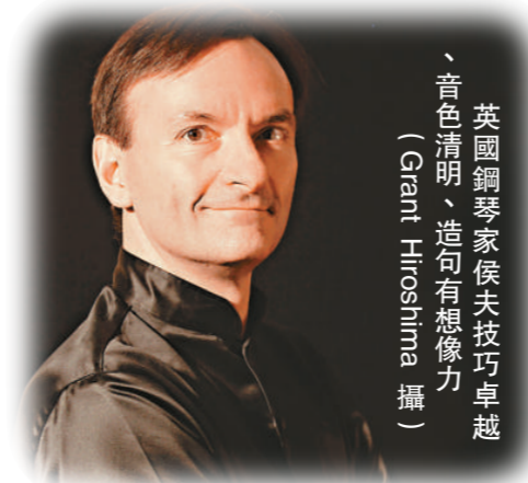
英國鋼琴家侯夫技巧卓越、音色清明、造句有想像力