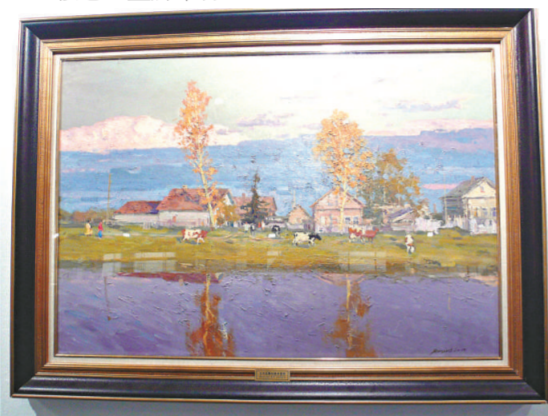
▲俄羅斯畫家德米特里油畫作品《白夜》，由主要介紹俄羅斯畫家作品的俄羅斯藝術畫廊提供（本報攝）