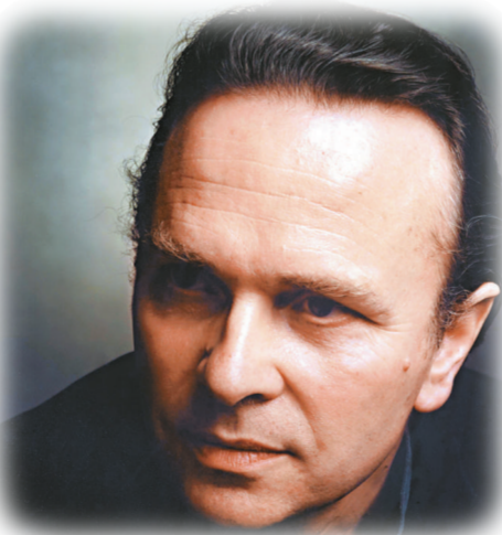
▲在艾爾達指揮棒下，「港樂」將布拉姆斯第一鋼琴協奏曲發揮得淋漓盡致

最後還得說說侯夫。他是當今英國的一線鋼琴家，唱片獲獎無數，當晚彈布拉姆斯的作品，似重視布拉姆斯與舒曼的聯繫多於貝多芬對布拉姆斯的影響（舒曼在生時對布拉姆斯很是賞識愛護，「第一鋼琴協奏曲」正是寫於舒曼離世前後），令演繹十分不落俗套；他的技巧卓越、音色清明、造句有想像力、搶板很多，效果很有青少年式的幽幽夢幻，令這首有時被彈得「太沉重」的名作煥然一新。筆