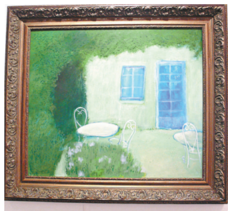
位於上海的奧賽畫廊提供（本報攝）