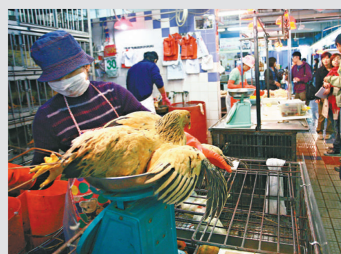
▲餓雞已久的市民買雞不手軟

至於售賣冰鮮雞的楊太則略顯門庭冷落，但她表示，自己早前交還活雞牌照，只是希望生活穩定一點。另外，康文署昨日重新開放元朗百鳥塔予市民參觀。百鳥塔自十二月九日起暫停開放給市民參觀，作為預防禽流感擴散的措施。康文署發言人表示，百鳥塔關閉期間，高級獸醫及職員一直密切監察百鳥塔，以及香港公園、香港動物園和九龍公園三個公園內，禽鳥的健康狀況，而所有禽鳥的健康保持良好。漁護署亦宣布，今日起將重新開放濕地公園的戶外部分予遊人參觀。