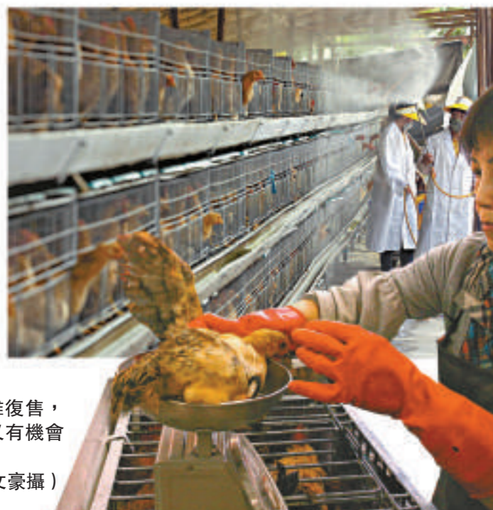
▶活雞復售，街市雞販又有機會一展身手