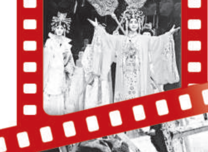
《蘇聯遺囑》奪劇劇藝術節銀獎