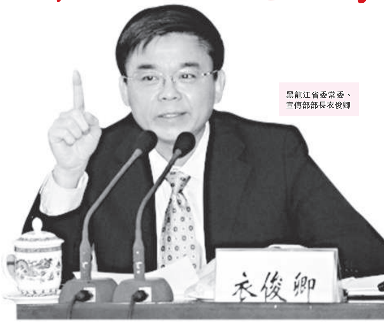
黑龍江省委常委、宣傳部部長衣俊卿