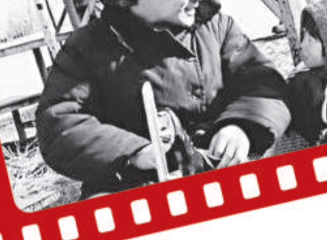
電影《千鈞一髮》劇照