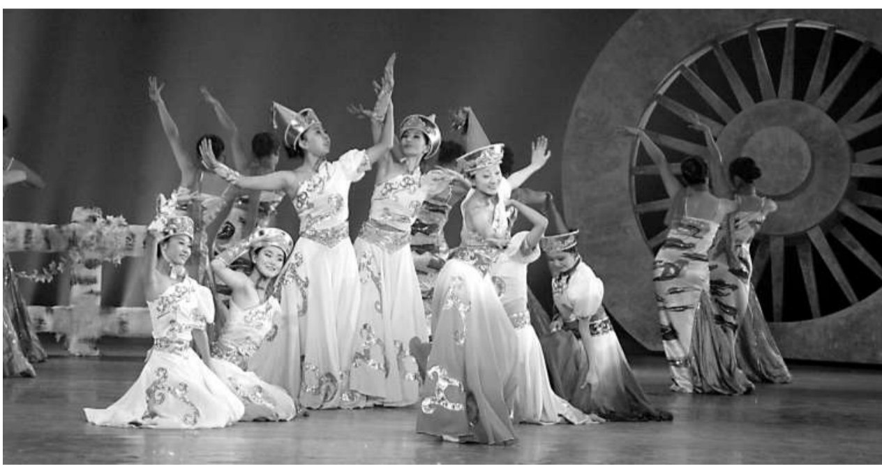
黑龍江省選取具有代表性的四個少數民族鄂溫克族、赫哲族、達斡爾族、鄂倫春族特色文化編排成歌舞《恩都力高拉》