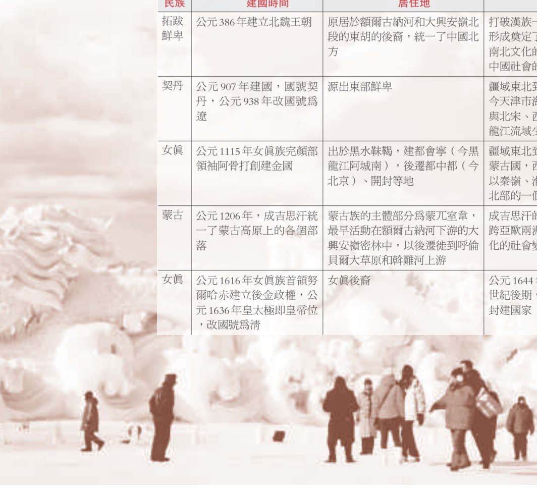
黑龍江流域少數民族五次入主中原