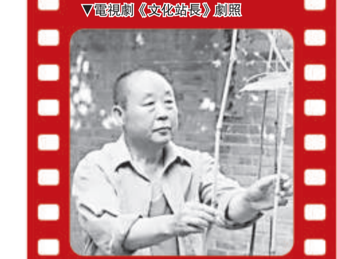
電視劇《文化部長》劇照

近年來，黑龍江文學藝術領域佳作迭出，頻繁獲獎，產生轟動效應，引發了人們對黑龍江創作、龍江製作的重新認識和思考。黑龍江文化具有什麼強勢競爭力，其品牌特徵是什麼呢？ 厚歷史沉積是根本 文化品牌有如下的特性：一是地域性標誌，具有很強的識別意義。文化品牌作為地方名片、地域符號，對地方經濟和文化的帶動作用是巨大的。二是內涵豐富。具有豐富的文化底蘊和歷史積澱支撐，人文色彩濃厚，具有民族身份認同因素，常說常新，歷久彌新。三是具有廣泛的受眾基礎。品牌不僅代表著作家藝術家對消費者的了解，也代表著消費者對作者的忠誠。 目前黑龍江文化品牌以名人品牌為主，老的品牌有蕭紅、東北作家群、蕭軍、馬、白子、鳳翔等一大批享譽海內外的作家藝術家；隨著茅盾文學獎、魯迅文學獎、曹禺戲劇文學獎、「五個一工程」等國家級獎項獲獎，繼而有遲子建、張明敏、楊利民等一批新品牌湧現。遲子建獲茅盾文學獎，都具有黑龍江強烈的地域標識性和深厚的歷史文化積澱，其核心是包容、大器、自由、開放、開拓進取。 獨特多彩文脈是基礎 黑龍江地處東北邊疆，歷史悠久、多民族聚居，形成了本土文化與移民文化、異域文化多元融合的文化格局。歷史文化資源豐富而又獨特，決定了黑龍江文脈的多樣性和獨特性，這些著名品牌正是黑龍江豐富多彩文脈的經典之作。 民族歷史文脈 。古代黑龍江孕育了五個入主中原的少數民族，兩大民族系東胡族系及其後裔鮮卑、契丹、蒙古、肅慎族系及其後裔粟末靺鞨、女真、滿族，在北方和全國範圍內先後建立了北魏、遼、金、元、清等王朝，奠定了中華民族多元一體的格局，促進了中華民族南北文化的大碰撞大融合。黑龍江古代民族對中華文化發展做出的卓越貢獻，在中國歷史是獨一無二的。以遲子建為代表的一大批原生態文化作品屢獲大獎。獲茅盾文學獎的遲子建長篇小說《額爾古納河右岸》，以最後一位女酋長的一天講述了一個民族一百年的歷史。被評為茅盾獎最高獎，以一曲對弱小民族的挽歌，寫出