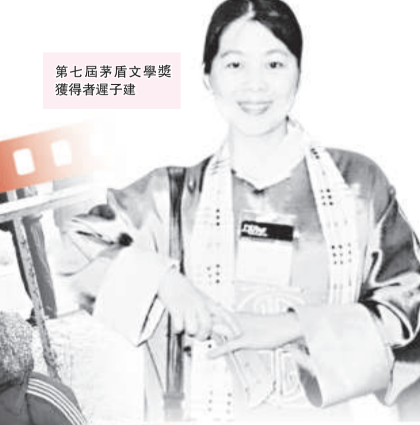
第七屆茅盾文學獎獲得者遲子建