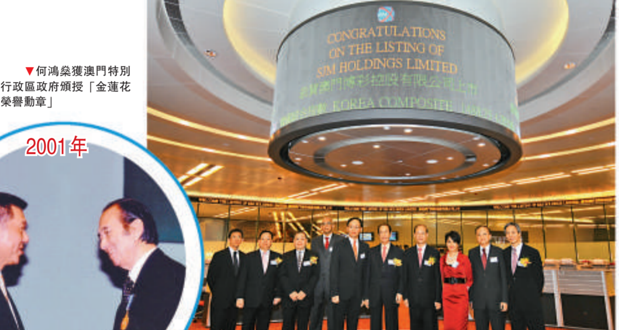
2008年7月16日 ▲澳門博彩控股有限公司在香港聯交所上市