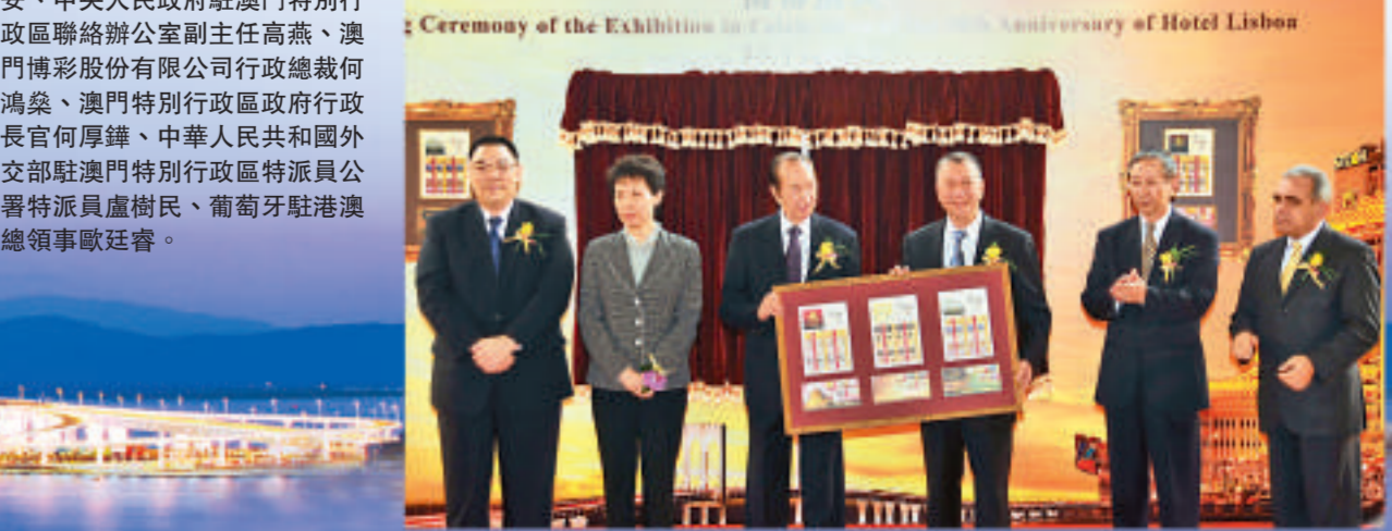
▲葡京三十八載劃時代輝煌展開幕。(左起)澳門特別行政區政府社會文化司司長崔世安、中央人民政府駐澳門特別行政區聯絡辦公室副主任高燕、澳門博彩股份有限公司行政總裁何鴻燊、澳門特別行政區政府行政長官何厚樸、中華人民共和國外交部駐澳門特別行政區特派員公署特派員盧樹民、葡萄牙駐澳門總領事歐廷晉。