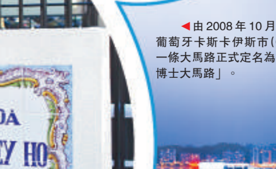
▲由2008年10月3日起，葡萄牙卡斯卡斯市(Cascais)一條大馬路正式定名為「何鴻燊博士大馬路」。