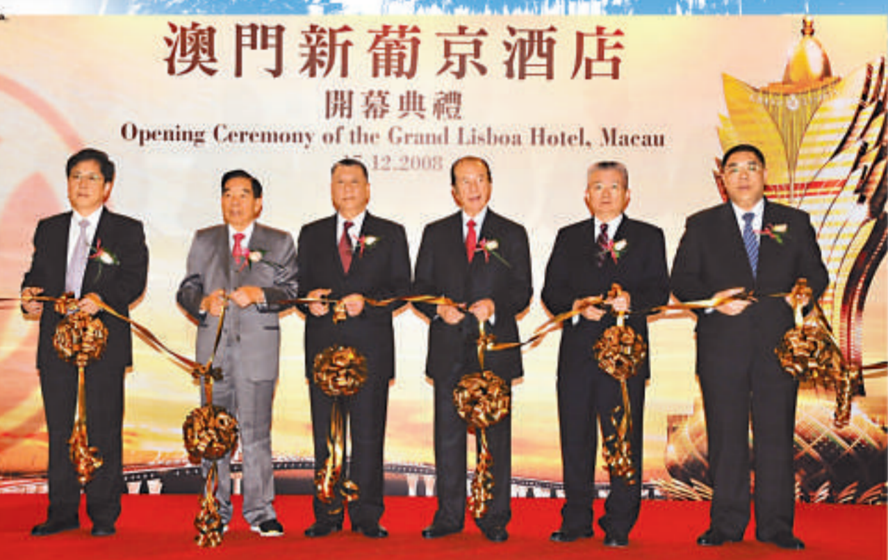
2008年12月17日 ▲新葡京酒店開幕儀式，由澳門特別行政區行政長官何厚樸（左三）、中央人民政府駐澳門特別行政區聯絡辦公室副主任徐澤（右二）、中華人民共和國外交部駐澳門特別行政區特派員公署副特派員宋彥斌（左一）、澳門特別行政區政府社會文化司司長崔世安（右一）、澳博行政總裁何鴻燊（右三）與澳博董事局主席鄭裕彤（左二）主持剪綵。