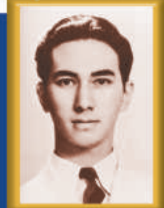
何鴻燊 博士年青時代的照片

紫荆，是香港特別行政區的標誌，蓮花，是澳門特別行政區的標誌，在全國政協常委、信德集團有限公司集團行政主席、澳門博彩控股有限公司主席何鴻燊博士的胸前，紫荆與蓮花「並蒂」盛放，交相輝映。何鴻燊早於2001年榮獲澳門特區政府頒授「金蓮花榮譽勳章」，2003年榮獲香港特區政府頒授「金紫荆星章」，2007年更獲澳門特區政府頒授「大蓮花榮譽勳章」，同獲港澳兩地特區政府最高榮譽，三「星」閃耀，何鴻燊是第一人。