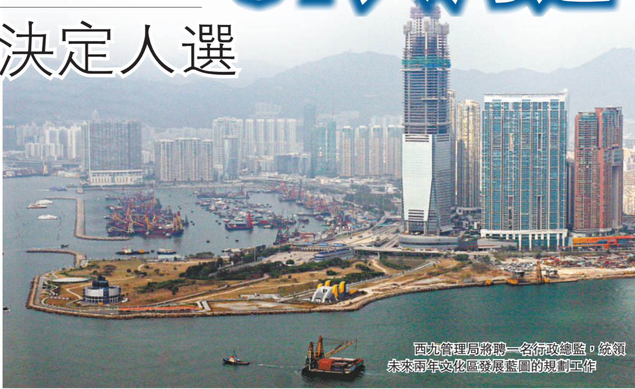
西九管理局將聘一名行政總監，統領未來兩年文化區發展藍圖的規劃工作

西九管理局行政總監招聘期已結束，行政總監一職年薪逾一百五十萬元，應徵者需具有超過二十年任職高級管理階層的經驗，但無須具有藝術機構管理的資歷。民政事務局前任秘書長尤曾嘉麗昨日會見傳媒時表示，由於管理局的前期工作主要涉及西九規劃，有較多申請人具有工程界的背景，局方需要多些時間研究，再確定人選。