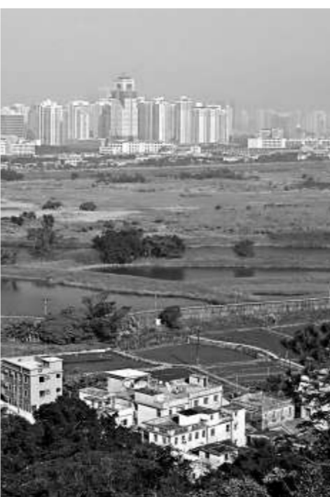
河套區建造工程預計於二零一五年展開

河套區鄰近蠔殼園和大羅口的魚塘、舊深圳河段、后海灣及米埔特殊科學價值地點和深圳河，亦可能會受建造工程泥土內的污染物影響，危害水域生物和水鳥。