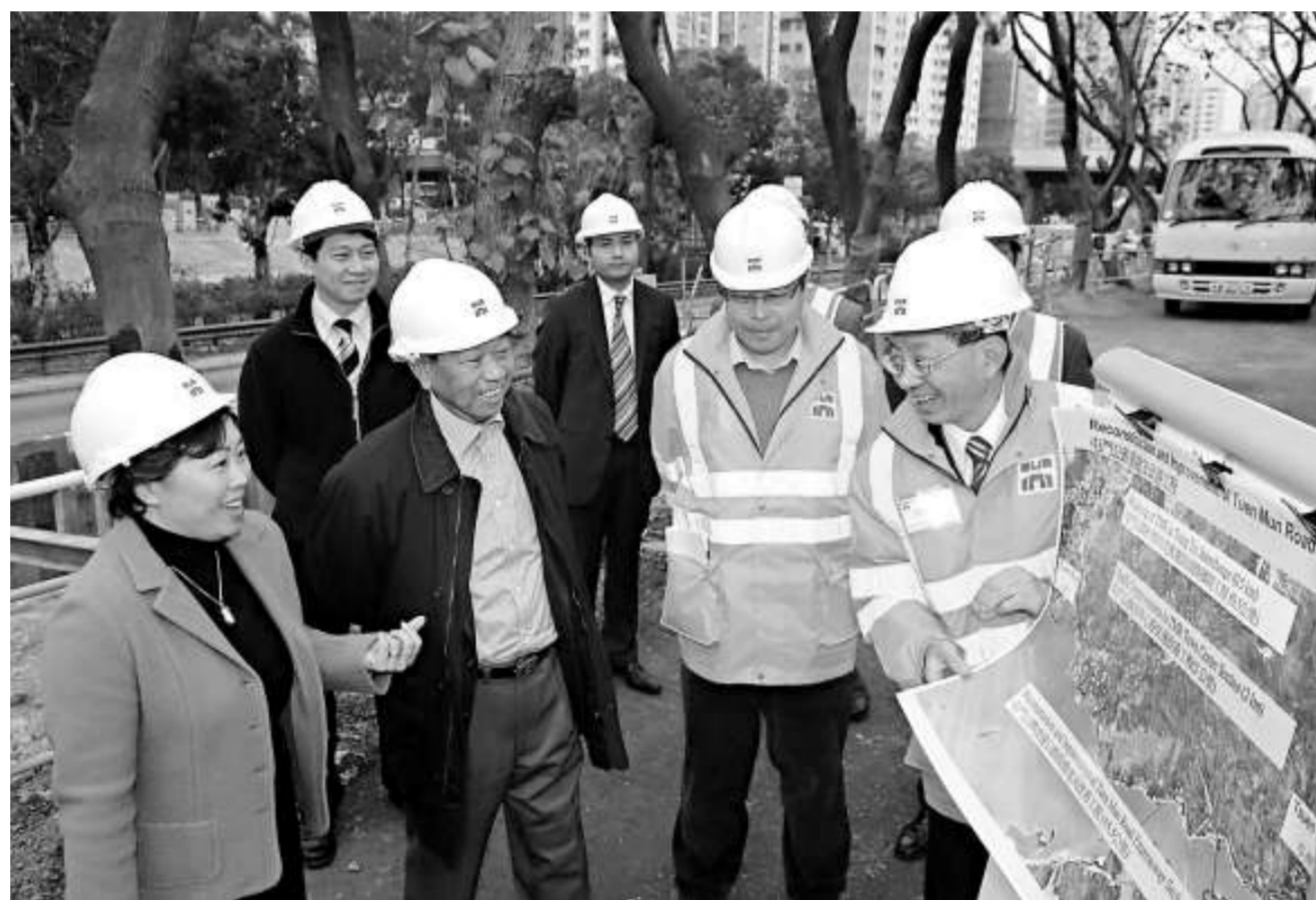
鄭汝樺視察屯門公路青田交匯處的工程進度

現時屯門公路重建和改善工程分為三部分：把青田交匯處擴闊為雙線三線分層行車道，並且安裝隔音屏障及鋪築低噪音物料路面；屯門公路快速公路段的重建和改善工程；以及屯門市中心段的擴闊工程。青田交匯處工程預計於本年底完成，屯門市中心段的工程可於二〇一二年完成，而屯門公路快速公路段預計在二〇一四年分階段完成。