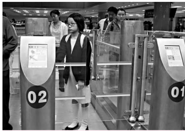
自助查驗通道令通關時間縮短至平均不到八秒

【本報記者方俊明珠海三十一日電】伴隨港澳居民三十年的書本式回鄉證今天全部到期，今後將由智能式回鄉卡全面取代，七百多萬港澳居民北上回鄉通關路，將徹底由「遞證—驗證—還證」的傳統手工驗放模式向平均不到八秒的自助通關轉變。目前，深圳、珠海的大部分口岸均設有自助通道，其中經拱北口岸五十條自助通道出入境旅客日均十二萬人次。