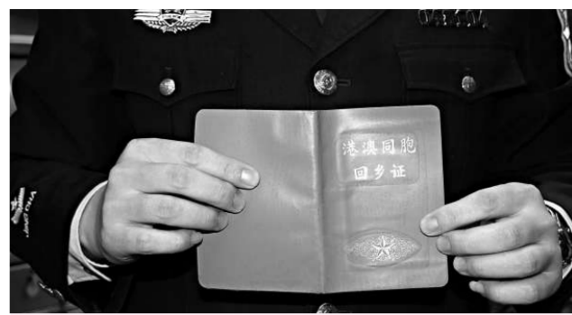
踏入09年，所有本式回鄉證都已過有效期限

「港澳回歸後，出入境過關手續逐漸便利化，而本式回鄉證在防偽性能、使用效率、管理水平等方面已嚴重滯後，因此公安部開發研製智能回鄉卡。」陸濶洲說，本式回鄉證於一九九八年十二月三十一日停止頒發，而外形好像信用卡的智能回鄉卡於一九九九年一月十五日起開始啟用，邊檢人員僅需將其插入OCR機器，平均不用十五秒即可完成通關手續。