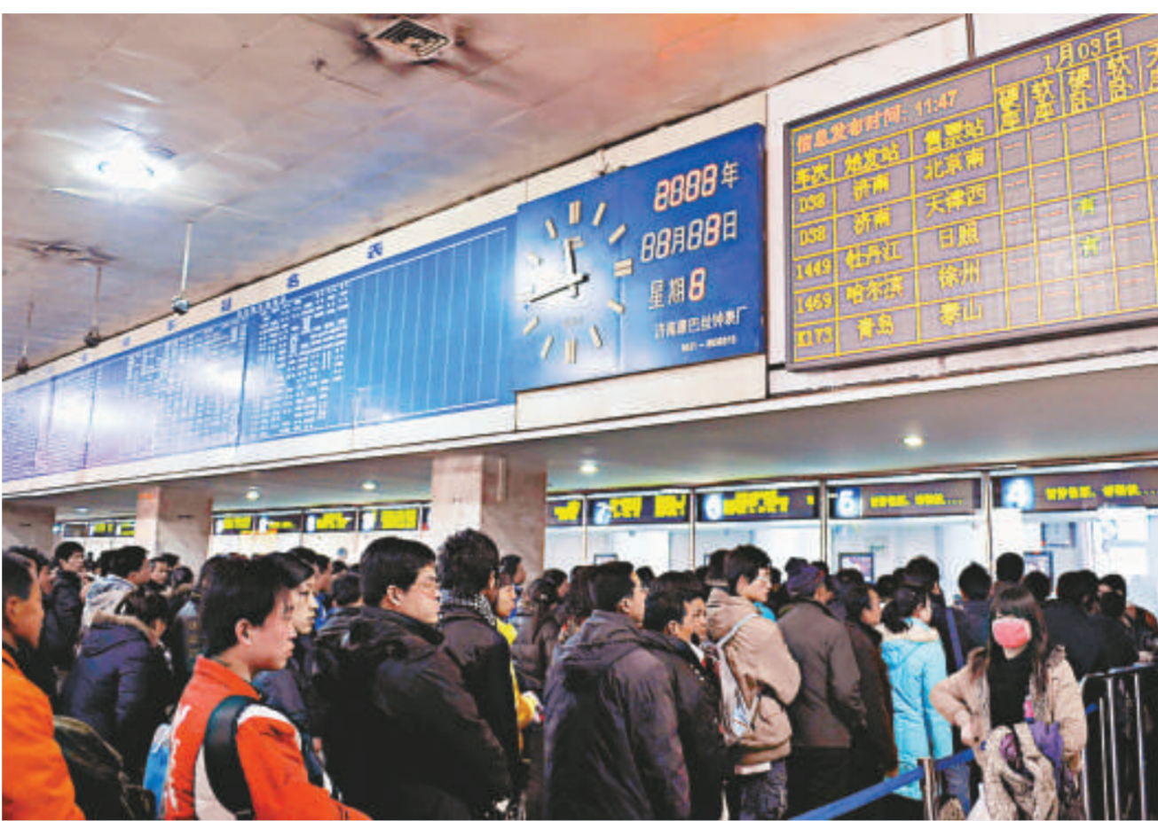
由於今年1月假期集中，返鄉民工流、高校學生流和探親流出現多流疊加現象，山東交通系統較往年提前十日進入「春運」。根據濟南鐵路局春運方案，鐵路客流高峰將出現在1月20日，預計春運期間發送旅客將達到630萬人次，增幅16%。圖為3日在濟南火車站售票廳購票的旅客長龍