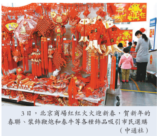
3日，北京商場紅紅火火迎新春，賀新年的春聯、裝飾鞭炮和春牛等各種飾品吸引市民選購（中通社）

另外，節日期間各大餐飲集團和企業加大促銷活動力度，餐飲企業營業額普遍增長。據對北京市36家餐飲企業242家門店的監測，節日三天營業額同比增長17%，老字號企業、連鎖經營企業等增長尤為明顯。麥當勞、肯德基、必勝客等洋快餐也打出「結伴過冬」、「價格低過十年前」等口號，紛紛降價促銷，最高降幅達到了四成，有效地促進了銷售。據北京市商務局生活必需品監測系統監測數據顯示，元旦期間北京市生活必需品市場供應充足，糧、油、肉、蛋價格穩定，蔬菜批發價格微幅上揚，豬肉市場價格穩定。