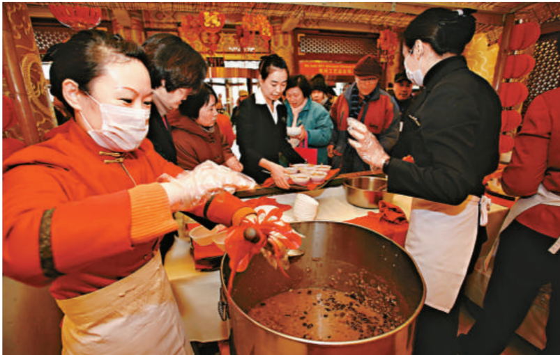
餐館服務員為眾人盛粥