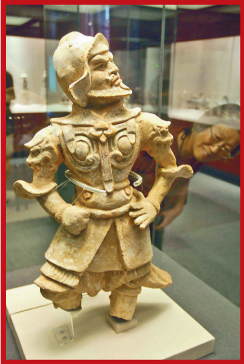
唐代高傲的天王俑