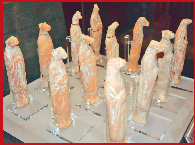
唐代的十二生肖像