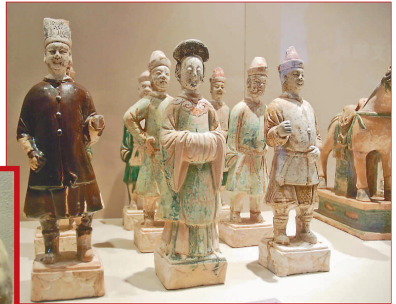
元代進入中原的胡人。其服飾與漢人已經融合

大氣、莊嚴的北魏菩薩立像，古樸、尊貴的漢代陶製編鐘，威武、奔放的漢代彩繪陶馬，栩栩如生的唐代十二生肖俑……由國家文物局和首都博物館聯合主辦的「成功追索流失海外的中國文物」專題展覽，日前在北京歷代帝王廟拉開帷幕。展覽共展出最近幾年間中國政府從丹麥、美國、日本、瑞典重金回購，以及海外愛國華僑捐贈的一百九十五件珍貴文物，這些文物不僅展現了中國古代高超的創作技藝，且為考古研究提供了難得的實物資料。