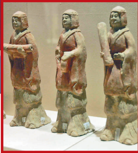
正在演唱的東漢歌俑