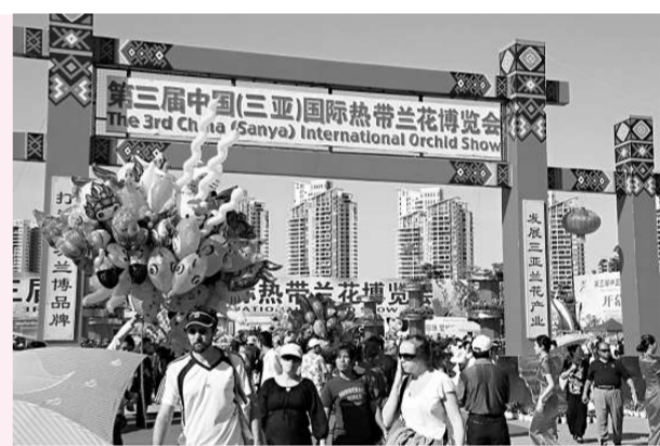
三亞「蘭博會」吸引眾多國內外遊客參觀（本報攝） 「蘭博會」上，穿戴蘭花的「花仙子」（中通訊）

「蘭博會」期間還將舉辦花藝、蘭花科普知識講座、國際蘭花學術論壇，以及展示與蘭花相關的書畫、攝影作品等一系列豐富多彩的蘭花文化活動。展館從5日至11日對外開放。展館開放期間，遊客、市民可盡情領略蘭花的美麗非姿，感受南國熱帶風情。