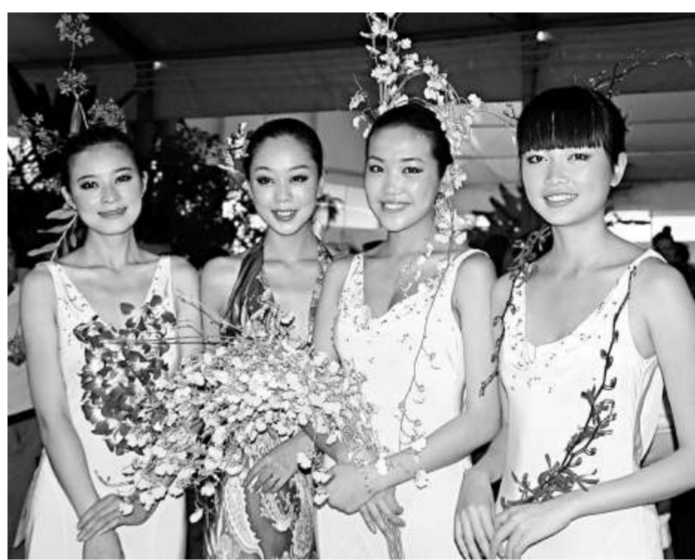
據悉，三亞素有「天然大溫室」之美譽，發展熱帶蘭花得天獨厚。近幾年來，三亞市把熱帶蘭花產業作為重點發展和扶持的項目，自2004年起，每年都安排300萬元專項資金。去年，三亞市更是大手筆投入7000萬元建設蘭花種植示範基地和扶持農民種植蘭花等，使熱帶蘭花產業有了長足發展，有望成為三亞農村新興的支柱產業。目前，三亞有蘭花種植企業12家，種植面積約2000畝，熱帶蘭花種植面積居海南之首，並培育100多個蘭花種苗品種。

香港蘭藝會名譽主席胡炳熾表示，由於初次參加「蘭博會」，參展準備時間倉促，香港蘭花展區以造型為主，略顯不足，但一場由蘭藝會主辦的香港蘭花展將於5月初舉行，屆時，另一場蘭花盛會將在香港上演。