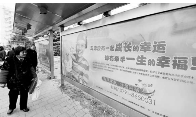
街頭徵婚廣告「有鳳求凰，我是阿楊」大型徵婚廣告燈箱日前出現在江西省南昌市40多個巴士站和30多輛巴士上，徵婚人是一名38歲的楊姓企業老闆。這種前衛且公開的徵婚方式吸引了路人的目光。（新華社）

山東省第四屆「東方麗人」全國高校模特、空乘專業推介會5日在青島大學舉行，吸引了包括北京服裝學院、北京舞蹈學院在內的50多所藝術院校和山東省內600餘名藝術系考生參加。據了解，本次推介會主要有學生自我展示、院校介紹、考生信息交流會、高校諮詢會、模特專業高考研討會等幾部分內容。圖為考生在推介會上進行泳裝展示。（新華社）