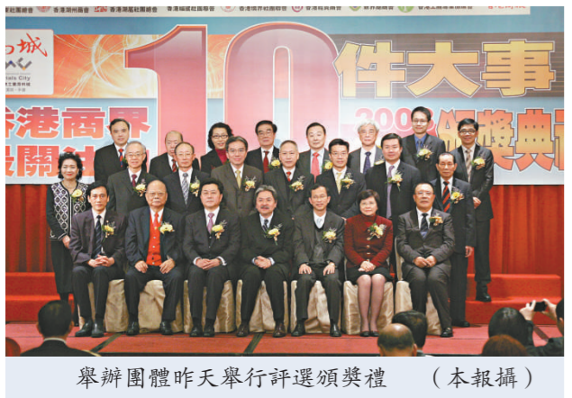
舉辦團體昨日舉行評選頒獎禮

參與這次評選活動的商會和社團包括：香港中華總商會、香港中華廠商聯合會、香港工業總會、香港中國企業協會、香港專業聯盟、香港中華出入口商會、香港工商專業聯合會、九龍總商會、香港廣東社團總會、香港潮州商會、香港潮屬社團總會、香港福建社團聯合會、香港僑界社團聯合會、香港經貿商會、新界總商會和香港工商專業協進會。中聯辦副主任李剛、立法會主席曾鈺成、香港商報社長黃揚略等均有出席昨日的頒獎禮。