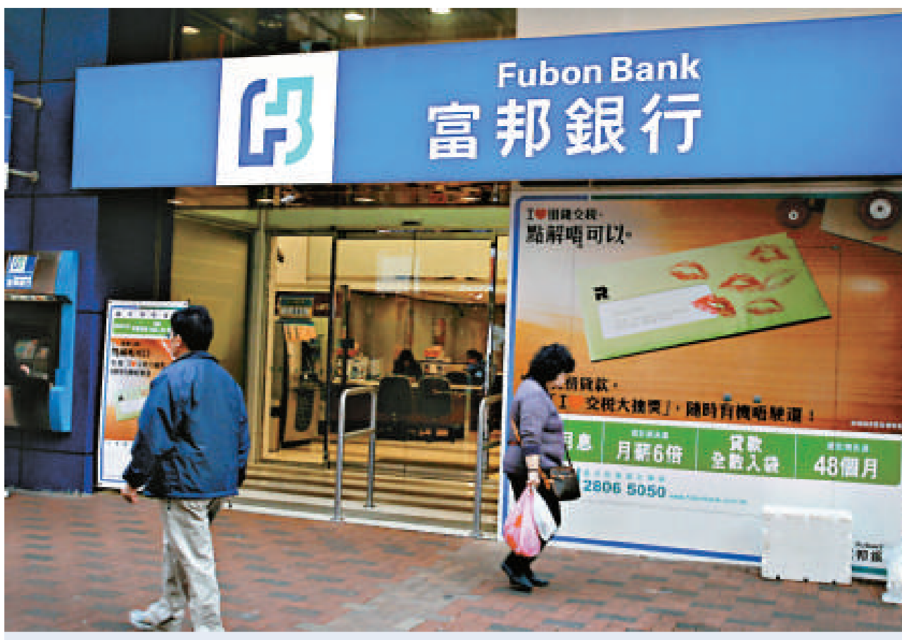
富邦銀行發生懷疑有職員在批核貸款時受賄事件