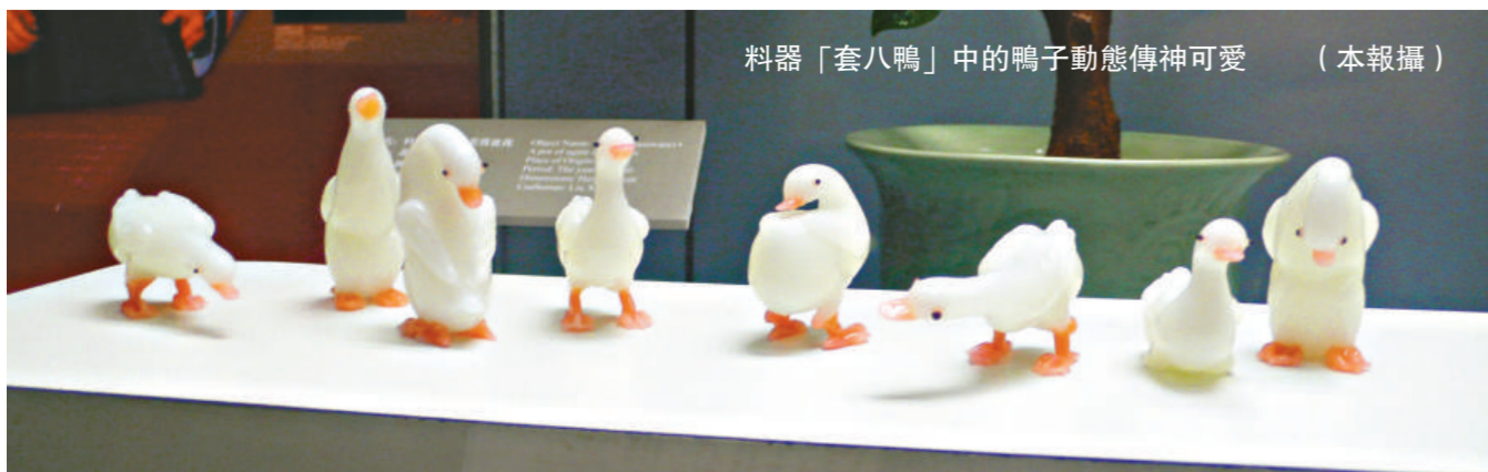
料器「套八鴨」中的鴨子動態傳神可愛