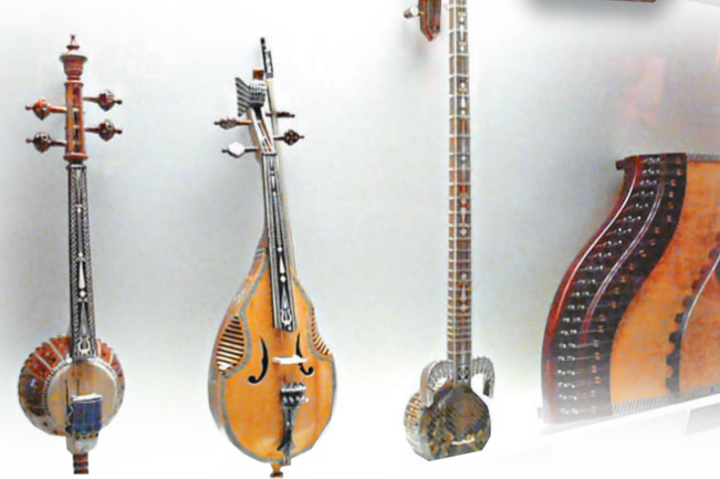
▲新疆維吾爾族木卡姆所用的樂器