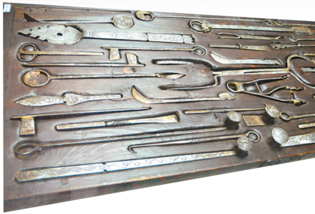
▲清代藏族手術器械，每一件都刻着精緻的圖案

在展場的四方柱上，掛着一些各種色彩神祕的臉譜。張剛介紹說，這是位於貴州安順一種稱為地戲的面具。顧名思義，地戲不用在搭建的舞台上表演，只在地上演出，那是明代開始，於我國貴州或雲南少數民族地區生活的漢人村莊流行的一種戲曲表演，當時有很多來自南京、浙江一帶的漢人在少數民族村寨駐，他們在大節日期間便邀請戲班來演出，這些曲調接近當地少數民族音樂，但語言則是明朝的官腔。五、六百年流傳至今，在安順共有一百多個地戲戲班，每個戲班只演一齣戲，內容大都是《三國演義》、《楊家將》等故事，通常在正月初二演至正月十八，才演完一齣戲。現場展出的面具，便是演地戲時，掛在演員額頭演出。