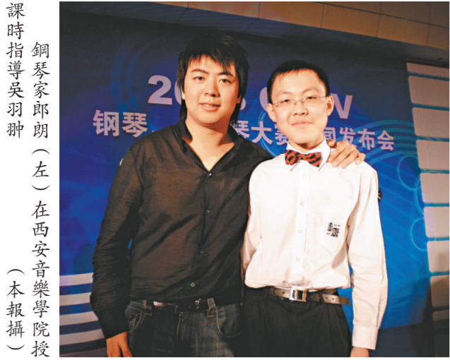
鋼琴家郎朗（左）在西安音樂學院授課時指導吳羽翀