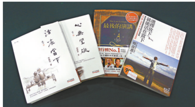
心靈文學作品及勵志書受到香港讀者歡迎