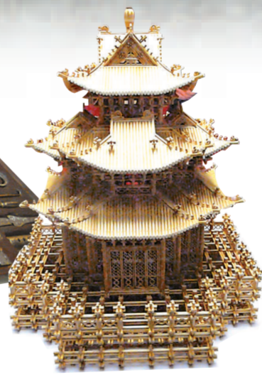
▲河北永清精製扎刻《故宮角樓》仿效故宮建築的入榫形式而製