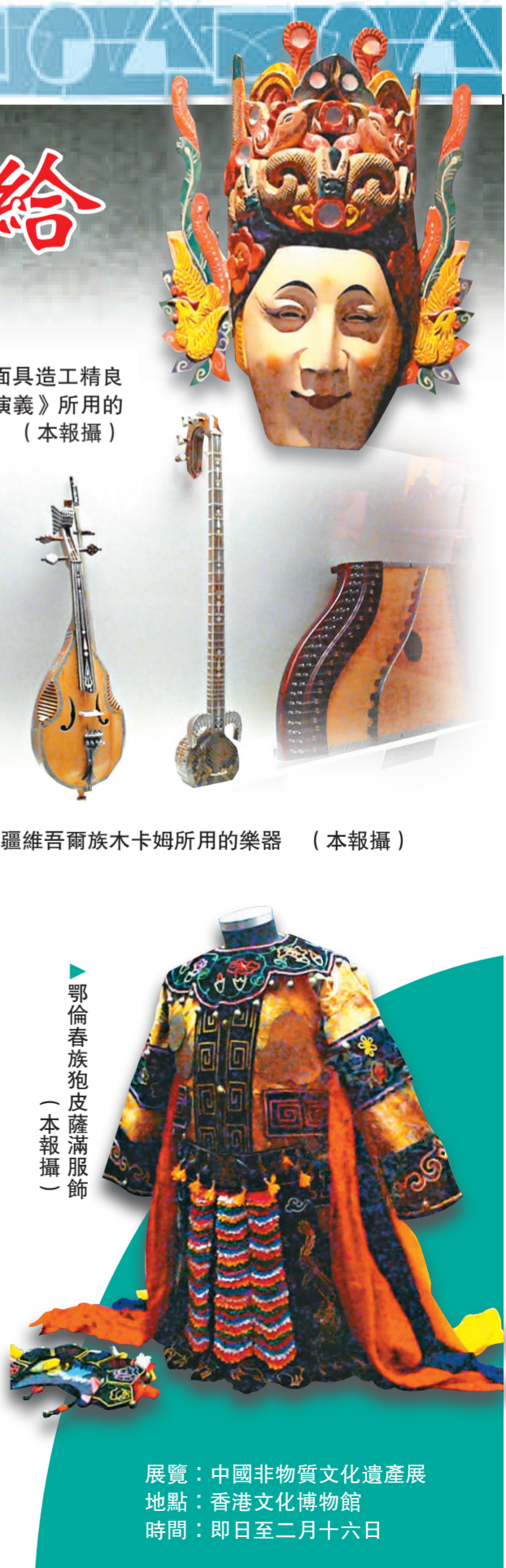
▶鄂倫春族狍皮薩滿服飾