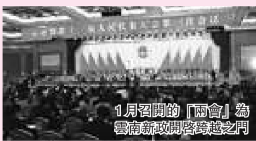
1月召開的「兩會」為雲南新政開啟跨越之門

農、工業發展、服務業發展、科技創新、節能減排、社會保障、醫療衛生、教育、基礎設施建設、綜合改革、對外開放、精神文明和民主法制建設等10項重點工作，昭示了08年新政新氣象。