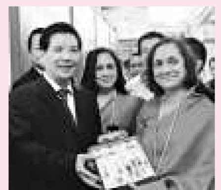
省長秦光榮(左)訪問印度

11月上旬，秦光榮省長率團赴阿聯會及印度展開「親鄰之旅」，它不僅進一步深化雲南與阿聯會、印度的雙邊關係，還為第三亞歐大陸橋的貫通打下堅實的合作基礎。在加爾各答和德里的兩項旅遊文化、經貿推介會均大獲成功，雙方共簽署涉及文化、旅遊、商貿、教育、城市合作等多領域的5項合作協議及備忘錄，取得實質進展，成為雲南歷史上規模最大、規格最高、影響最廣的南亞之行、親鄰之旅。此次訪問進一步揭開了滇印友好合作發展的新篇章，踐行了服務國家大外交之理念，為中印兩國的戰略合作發展奠定堅實基礎。