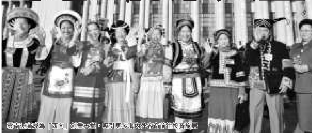
雲南逐漸成為「西向」創業天堂，吸引更多海內外客商前往投資旅居

縱觀2008年，雲南經濟增長的速度、結構、效益和規模等指標都登上新台階，綜合經濟實力顯著增強。在全球遭受金融危機的影響下，仍然基本實現了年初提出的各項指標目標。群眾的滿意度和幸福指數大升，居全國前列。2008年1至11月雲南進出口總額達90.3億美元，同比增長14.2%；社會消費零售總額約1508億元人民幣，增幅23%。文化方面捷報頻傳，全國青歌賽中雲南代表隊奪得省級地方代表隊第一的好成績；於香港落幕的第10屆國際藝術家音樂比賽成為雲南參加國際比賽選手人數最多、獲獎最多的一次，並在舉世矚目的京奧和殘奧上展示了邊疆各族人民的積極風貌。