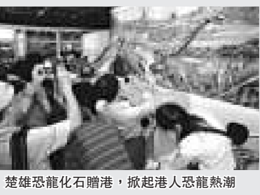
楚雄恐龍化石贈港，掀起港人恐龍熱潮

由雲南省副省長劉平率隊的「七彩雲南·魅力楚雄香港行」系列活動在港拉開帷幕，同時舉行楚雄州人民政府招商項目推介會暨簽約儀式。楚雄州與5家香港企業簽訂多項投資合作合同，協議金額107億元。同期舉行的「魅力楚雄——楚雄彝族自治州文化展」，展示了逾30件由楚雄州博物館藏品中挑選出來的珍貴展品。