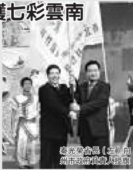
秦光榮省長(左)向州市政府負責人授旗

加強滇西北生物多樣性保護，促進生態文明建設，滇省政府首次召集海內外民間環保專家、學者等共倡滇西北生物多樣性保護。秦光榮省長就此對總體思路、保護目標、工作原則、工作重點、工作措施等重大問題作出明確的規定，提出具體要求，並向麗江、大理、迪慶、怒江、保山等5州市政府負責人授旗，共同發表《滇西北生物多樣性保護麗江宣言》，向世人表明雲南保護生態環境、建設美好家園、維護生態安全、構築生態屏障的信心與決心。