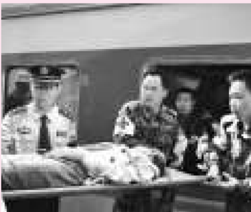
雲南支援汶川救災

四川汶川遭受中國歷史上破壞力最大的一次地震，波及滇省7州市。雲南省在做好自救的同時，不遺餘力地幫助四川災區渡過難關。當日即組織地震災害緊急救援隊，共有15,000餘人趕赴四川災區幫助抗震救災，組織多批醫療隊赴災區救護、啟動愛心專列接收災區同胞、為災區兒童找到新家庭和學校、為國寶大熊貓另闢家園等等，從人力、物力、財力等方面給予四川很大的支持。