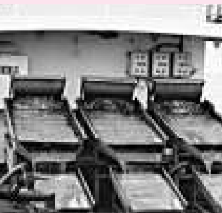
治污工程刻不容緩

有着「高原明珠」美譽的陽宗海因磷污染，造成周邊2.6萬餘人的生產生活用水受到影響。同月，在滇池治污進入關鍵階段時，滇池水污染防治專家督導組在昆明成立，旨在重點督促責任單位按時完成滇池水污染治理重大項目建設和重要工作，參與省政府組織的防治目標責任書檢查考核，指導防治技術研究與推廣應用、滇池流域「四退三還」等生態修復建設、滇池生態補水工程建設及其他相關工作。兩個典型的環保反面教材，使雲南再次看到落實科學發展觀之要義。