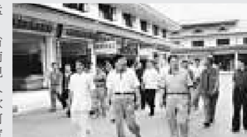
官員多了解民情有助建立和諧社會

7月19日雲南省普洱市孟連縣發生警民暴力衝突事件，兩人死亡。事件發生後，滇省上下全體官員深刻反思。雲南省委副書記李紀恆對孟連現象提出嚴厲批評：「說話沒人聽，幹事沒人跟，群眾拿刀砍，幹部當到這份上，不如跳河算了！」他提出，各地要切實引以為鑒，加強基層黨政組織的領導班子建設，提高基層黨政組織在群眾中的公信力、號召力和凝聚力。要提高基層黨員幹部調解矛盾糾紛的能力，及時把各種帶有苗頭性的問題和矛盾解決在當地、