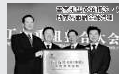
雲南推出多項措施，協助商界面對金融海嘯

確保08年全省生產總值增長12%以上，全部工業增加值達到2050億元，固定資產投資完成3360億元以上。08年省財政再新增10億元，並出包包括加大財政投入力度；保持信