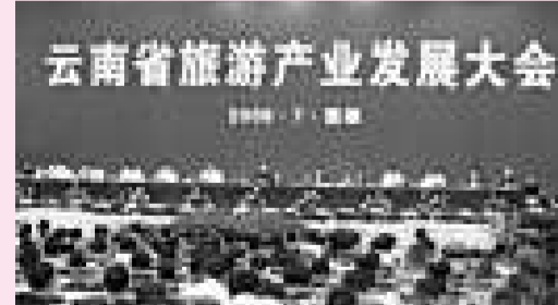
雲南推動旅遊「二次創業」

善的旅遊產品基地，培育一批全國一流、世界知名的名牌旅遊產品，推出一批具有較強吸引力的黃金旅遊線路，加快推進旅遊產業「二次創業」，努力實現雲南由旅遊資源大省向旅遊經濟強省的新跨越。