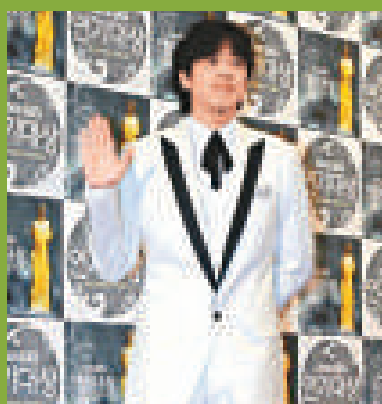
▲柳時元腰痛舊患復發，令他苦不堪言 ▶柳時元在日本舉行演唱會時，需靠鎮痛劑來支撐

韓流天王柳時元，最近在個人網頁上留言，指自己自去年底日本演唱會後，腰痛舊患復發，令他苦不堪言，上周五他更入院進行手術。他在留言中更說，這次腰痛簡直是要了他的命，更令他首次因太痛而流下男兒淚。早前他舉行日本演唱會時，更需靠鎮痛劑來支撐下去。他希望新的一年能健健康康，遠離病痛。