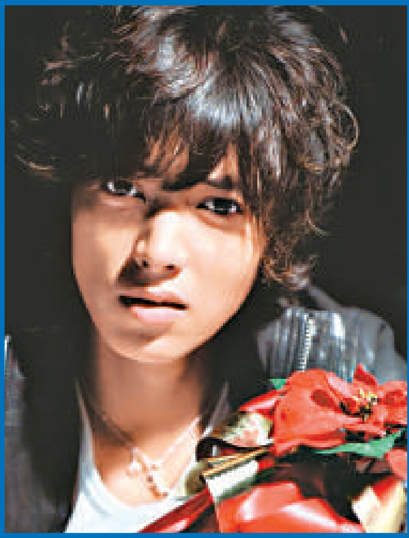
▲山P有意再為《Code・Blue》拍續集

此外，山P與新垣結衣等合演者在日前出席特別版的試映會，再次談到拍劇的感受，他說：「今次拍攝使我明白到離別使人堅強的道理，也令我有所成長，如果觀眾看過後能更珍惜身邊的人便好了。」山P又談到新年願望，說已轉換了心情來迎接新的一年，同時也希望自己領軍的組合「News」能在今年有更大發展空間。儘管山P今年犯太歲，但看來他依然信心十足，誓要在今年繼續大放光芒。