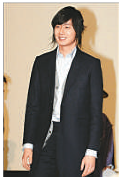
◀韓國傳媒看好鄭日宇扮演一枝梅，可與李準基一較高下 ▼鄭日宇主演的《一枝梅歸來》海報曝光

廣告以「兩個我」為主題，田中化上黑色和白色的裝扮，表達出「女性的美有無限的可能性」此訊息。田中花了兩日時間拍攝，她表示廣告無論在裝扮、背景和手法方面都很嶄新，連她自己亦感到很有新鮮感。