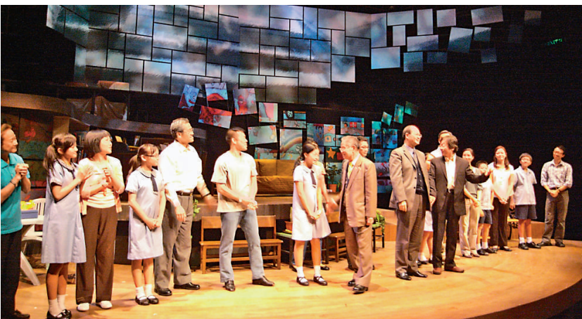
鮮魚行學校校長、師生與中英劇團工作人員接受觀眾致敬（本報攝）

中英劇團的富豪華，把校長熱愛小朋友、誓為校園帶來新氣象的情懷——道出，其教育老友何先生則活現山人自有妙計