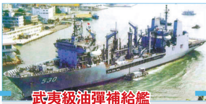
武夷級油彈補給艦