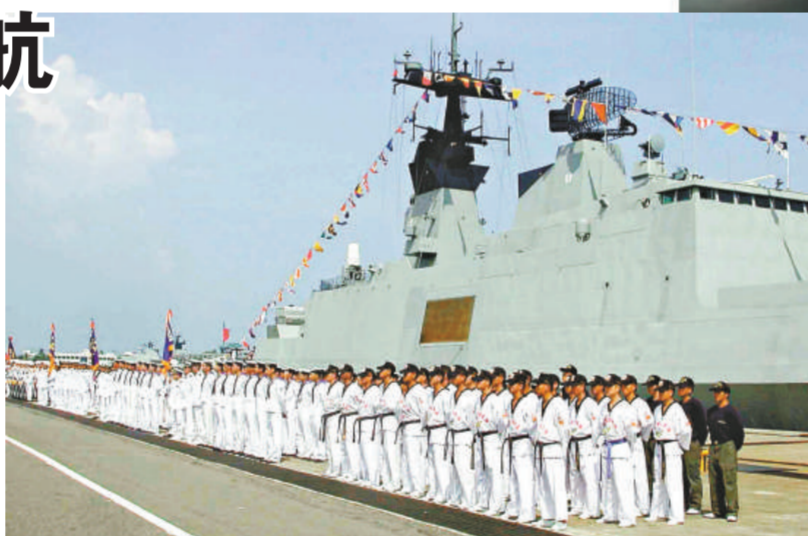
島內一位退役海軍軍官表示，台灣海軍久訓不戰，不能因應可能的衝突也是問題。（資料圖片）

去年十二月二十九日下午，台灣海基會接獲大陸海協會副秘書長張勝林告知，如台灣商船在亞丁灣有護航需要，可透過海基會向對岸中國船東協會提出。不過，由於顧慮此舉會「衝擊台灣的主權形象」，台灣陸委會副主委趙建民八日表示，陸委會並沒有授權海基會接受船東申請，也就是說，不同意台灣商船向對岸預約護航；但台灣船隻如果遭遇緊急安全威脅，必要時不排除就近尋求包括大陸軍艦在內的任何管道前往援助。