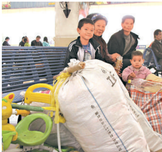
▲ 經濟不景氣的年關，大批民工攜家帶口撤離珠三角