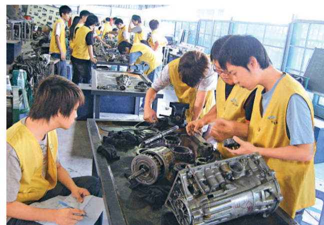
汽車專業學子自己动手解決問題

國家教育部、財政部日前正式公布了 2008 年國家級精品課程名錄，深圳職業技術學院 16 門課程榜上有名，至此，該校國家級精品課程數量達到 41 門，在全國高職院校中遙遙領先。幾年來，深職院在課程開發建設方面取得了一系列實質性成果：研究制定了 30 餘個專業課程方案和課程標準；建成了國家級精品課程 41 門，另有數量眾多的省級、校級精品課程；由深職院教師主編或參編出版的各類高職教材已達到 500 餘部，其中國家級精品教材 8 部、國家規劃教材 100 餘部，初步形成了類別比較齊全、高職教育特色鮮明的系列教材。(本報記者 王一梅)