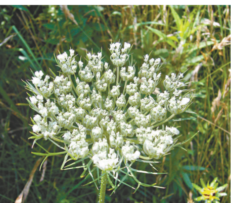
▲約有一萬五千種藥用植物瀕臨絕種

漢密爾頓說：「促進健康，增加收入，保持文化傳統，對於人們保護藥用植物，從而保護居住環境都是非常重要的。在開展保護工作的過程中，需要將人們的利益考慮在內。」