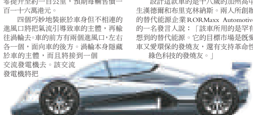
▲研究顯示，大笑有助燃燒脂肪

四個巧妙地裝嵌於車身但不相連的進風口將把氣流引導致車的主體，再輸往渦輪去。車的前方有兩個進風口，左右各一個，面向車的後方。渦輪本身隱藏於車的主體，而且將接到一個交流發電機去。該交流發電機將把