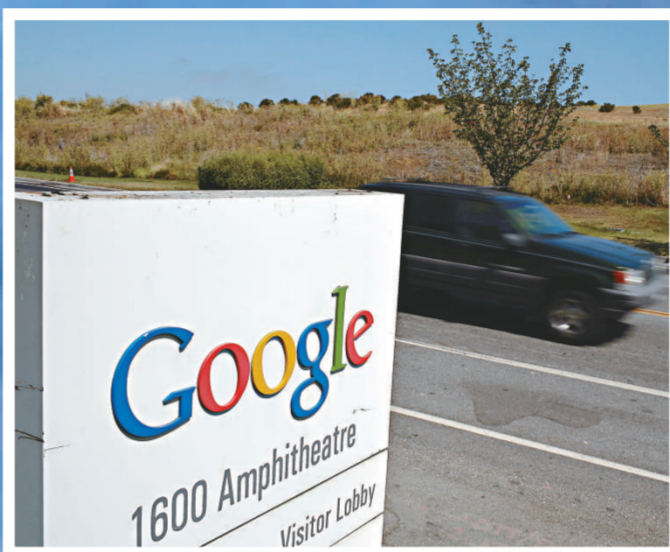
▲谷歌的總部位於美國加州 (互聯網)

目前，使用電腦及互聯網而排放的二氧化碳量已首次超過航空業，但社會顯然低估了使用電腦對環境造成的破壞。