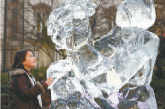
▲英國雕刻家雕出的巨型企鵝