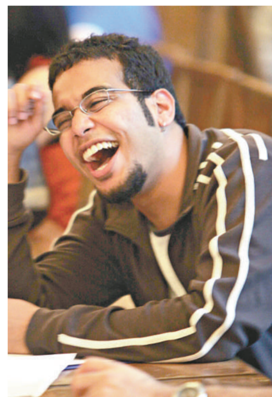
▲研究顯示，大笑有助燃燒脂肪

大笑一小時可以燒脂半安士，每天大笑一小時，一年便可以減磅十一磅。由此推算，每天若看半小時喜劇，一年便可以減去超過五磅的重量。