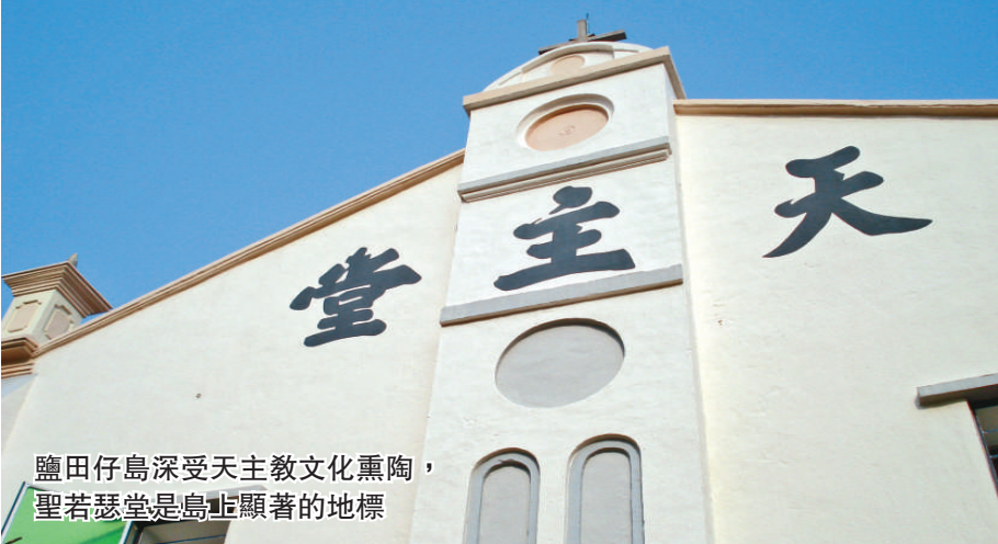
鹽田仔島深受天主教文化熏陶，聖若瑟堂是島上顯著的地標

鹽田仔島上的地標是聖若瑟堂，屬天主教教堂，頂部正中有「天主堂」三個大字。天主教於19世紀傳入該島，村民全部成為教友，乃於1890年興建此堂。鹽田仔是香港天主教的發源地之一。聖若瑟堂雖體積玲瓏，但典雅莊重，遊人無不愛之。它已有百多年歷史，修復後獲聯合國教科文組織文化遺產優異獎。此外，島上還保留聖福約瑟和陳丹書兩位神父的故居。由於受到天主教文化的熏陶，島上全無中式古廟和宗祠，在本港離島中十分罕見。