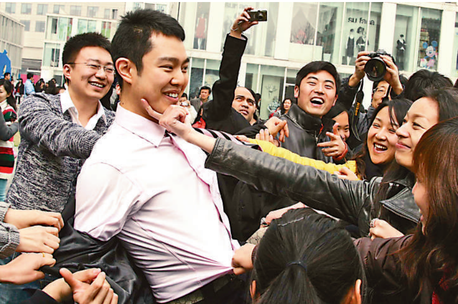
2008年4月1日，北京200多名青年進行集體5分鐘各種各樣的動作大定格，歡度愚人節

4月1日，人們可以任意地作弄人、開別人玩笑，惡作劇會被原諒，因為這一日是「愚人節」。