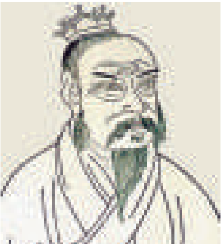
漢高祖劉邦年少之時就野心不小，終成大業

邦率領的漢軍逐漸坐大。楚漢兩國協議以鴻溝為界，鴻溝以西為漢，以東為楚，互不侵犯。但是，當項羽遵守諾言退兵，並放回被扣為人質的劉邦父母妻子後，劉邦卻背信偷襲。項羽退到垓下，劉邦用四面楚歌之計瓦解楚軍軍心。項羽走投無路，自覺無顏見江東父老，只好自刎於烏江邊。歷時5年的楚漢戰爭，終以劉邦一統天下、項羽徹底敗亡宣告結束。