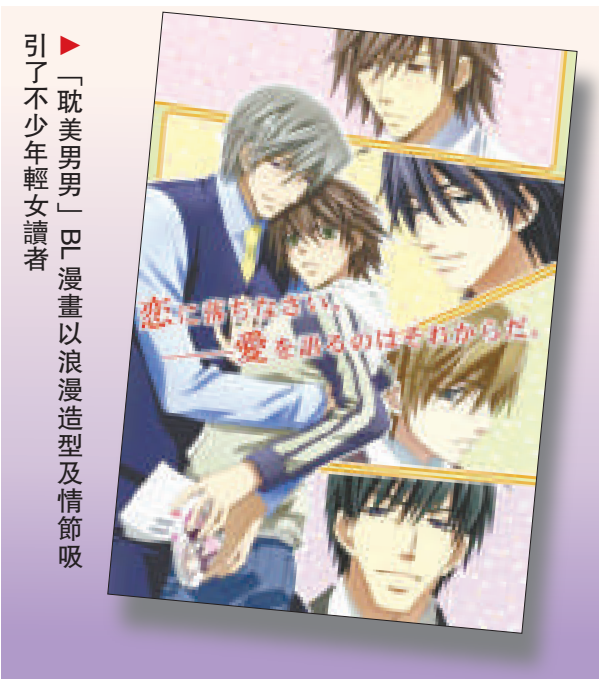
撰文：嶺南大學中文系（新聞寫作課程） 梁儀儀 屠靄琪

另外，BL漫畫在人物塑造方面以唯美著稱。大部分BL漫畫的男主角，都有一位是女性化的形象，如皮膚白皙、臉尖尖、大眼睛、精緻的五官、嬌小纖細的身形；而且，內容情節亦以浪漫為基調，近似現實的異性戀關係。反之，男同性戀漫畫的唯美性及浪漫性則較低。（上）