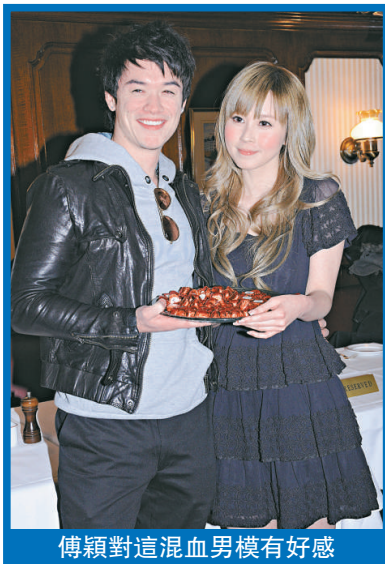
傅穎對這混血男模有好感