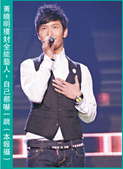
黃曉明獲封全能藝人，自己都嚇一跳（本報攝）