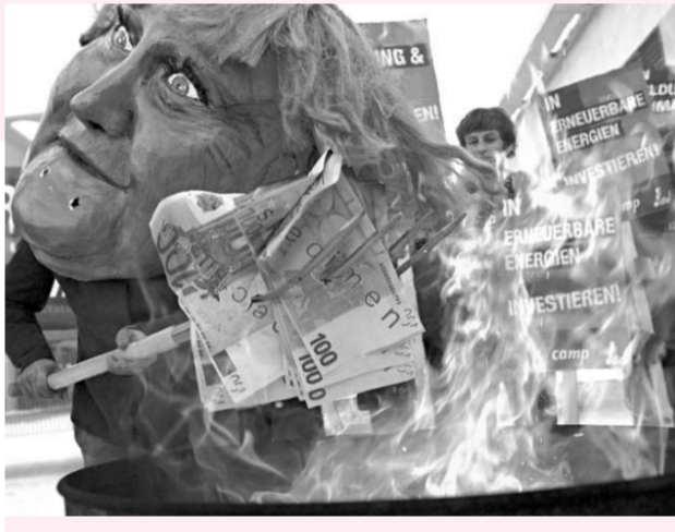
示威者戴着默克爾面具焚燒道具表示不滿

公共建設工程需要時間規劃和實施，這也是美國和其他國家提出的刺激措施同樣面臨的不足。許多經濟學家說，歐洲同美國一樣，給消費者減稅對刺激經濟增長的效果也不夠理想：家庭往往將減稅所得存入銀行，或者用它來償還債務及購買進口商品。