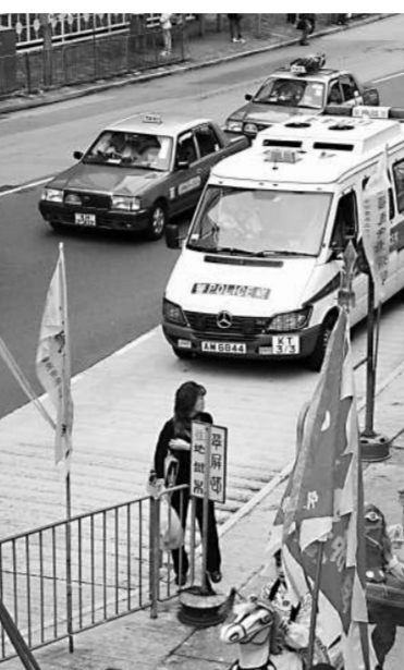
地藏王古廟的酬神活動是觀塘區一大盛事

據知該書印數不多，許多有興趣的市民索取不到，我希望區議會能再版，補充上述資料和有關圖片，更有效地發揮推廣地區文化的功能。