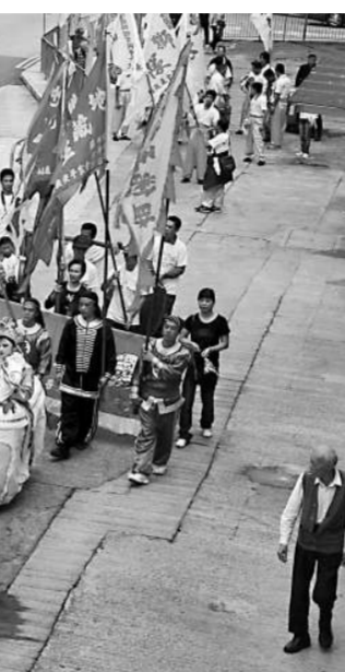
地藏王古廟的酬神活動是觀塘區一大盛事

香港十八區大部分都有出版風物志，而最新一本是觀塘。環顧現有的風物志，普通側重於歷史介紹，對於區內的風俗節慶點到即止，甚至忽略不提，以致許多富有特色的民間活動未為外界所知。