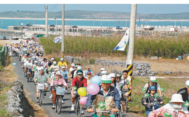
拜博奕話題所賜，十年來澎湖的土地價格已漲了四倍。(資料圖片)

澎湖爭取逾二十年的博奕條款，日前終於獲「立法院」通過，也讓澎湖再成投資的焦點，光是十四日就有英商滙京