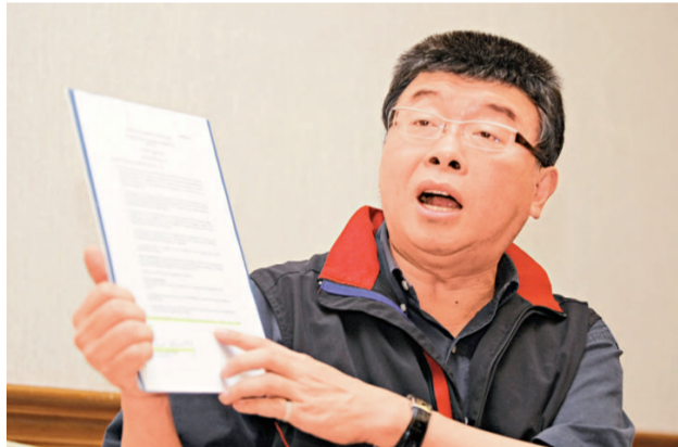
邱鈺慶爆料，指扁以民進黨的名義在海外開設密帳。(資料圖片)

【本報訊】據台灣媒體十五日報導：特偵組偵辦機密外交案，發現陳水扁在任內以「總統府」執行拉美專案的理由，要求「外交部」支付兩千萬美元，由台灣人公共事務協會前會長吳明基領走後，卻流向不明。檢方懷疑扁假機密之名