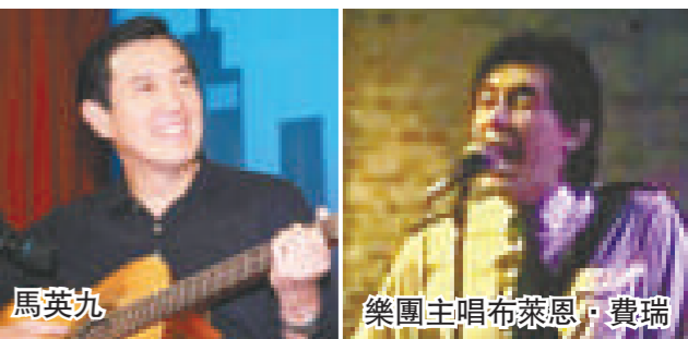
馬英九 樂團主唱布萊恩·費瑞

據環球網報導，布萊恩·費瑞是樂團「羅西音樂」(Roxy Music)的前主唱兼鍵盤手。「羅西音樂」被認為是影響英國流行與搖滾音樂最重要的樂團，長得超像馬英九的他對於美式靈魂音樂和披頭四音樂非常熱愛，加上電子音效合成樂手比利安·伊諾(Brian Eno)對於「地下絲絨」(Velvet Underground)式迷幻噪音語的實驗精神，讓羅西音樂帶動流行服飾、華麗彩裝與音樂影像的風潮，可以說是流行藝術與前衛思潮文化的先驅部隊。