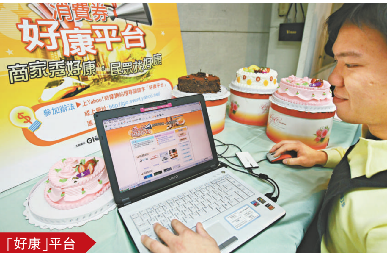
島內新聞局舉行消費券「好康」平台記者會，一家蛋糕店利用「好康」平台刊登消費券優惠資訊，推出價值新台幣八百元的情人節蛋糕，只需五百元消費券就可購買。