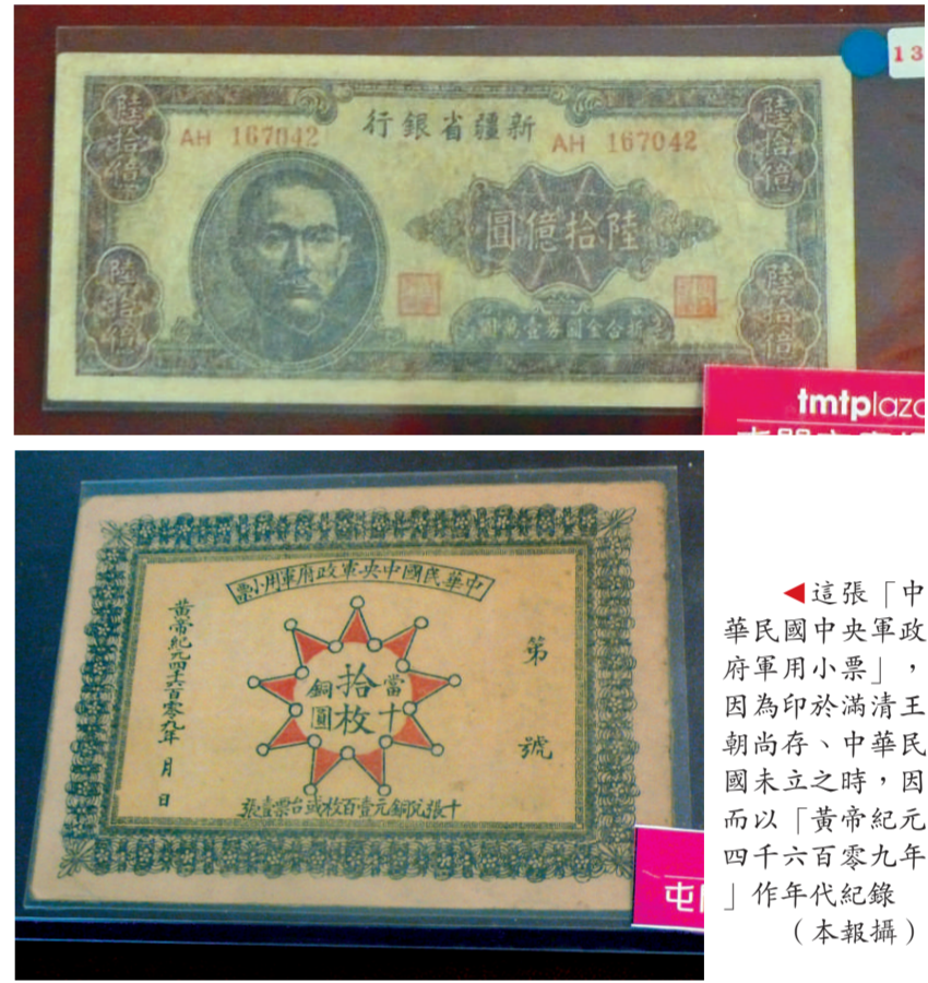
▲這張「中華民國中央政府軍用小票」，因為印於滿清王朝尚存、中華民國未立之時，因而以「黃帝紀元四千六百零九年」作年代紀錄（本報攝）