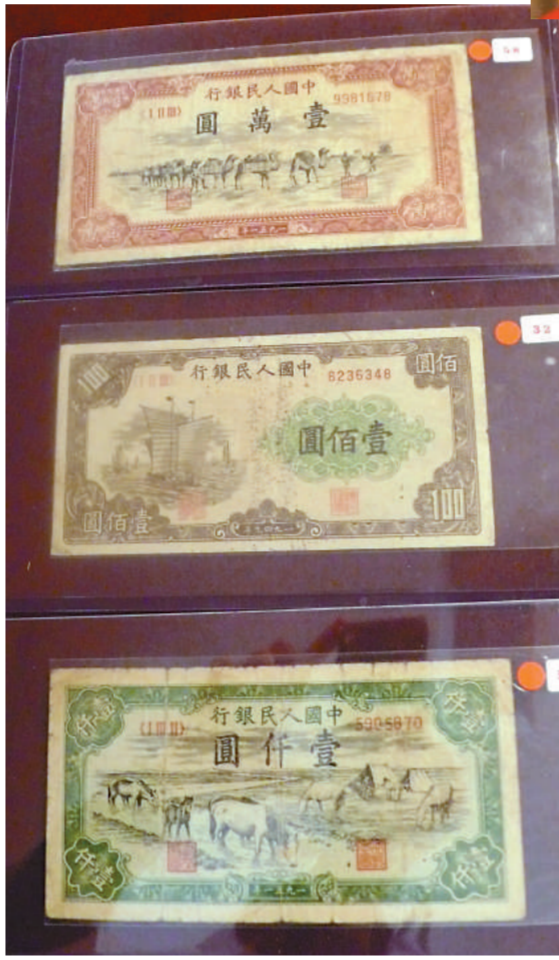
▲中國人民銀行發行的第一套人民幣紙幣