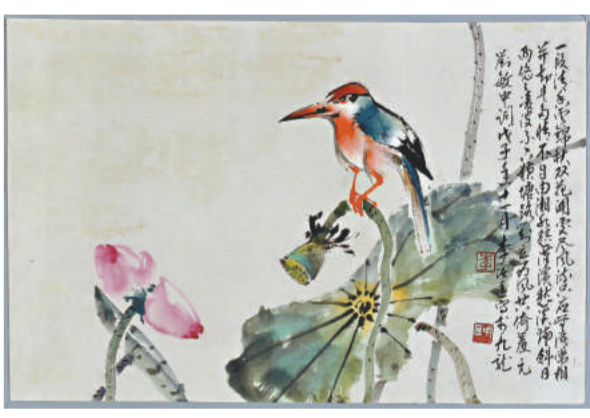
▲李汝匡於二〇〇八年創作的《帛琺紅頭翡翠》