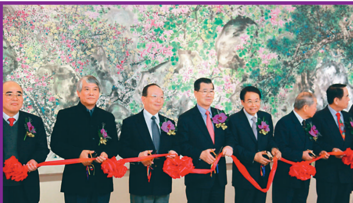
▲「蕭暉榮的藝術——中國畫·雕塑展」在台開幕

【本報訊】由台北「國父紀念館」和中華大道文教基金會聯合主辦的「蕭暉榮的藝術——中國畫·雕塑展」日前在「台灣國父紀念館」逸仙廳開幕，各界知名人士及藝術界代表三百多人出席。