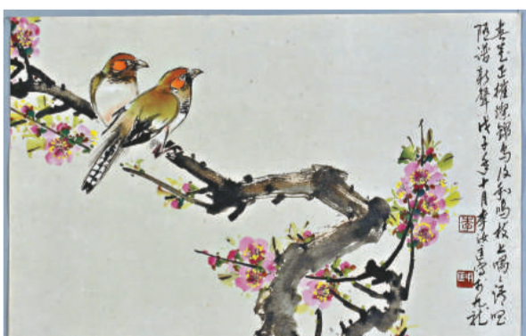
▲李汝匡於二〇〇八年創作的《錦花鳥》