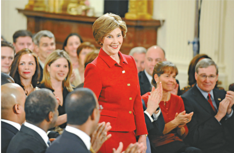
「第一夫人」勞拉與兩個女兒齊來捧場