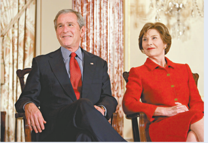
布什夫婦十五日到美國國務院與一眾官員話別