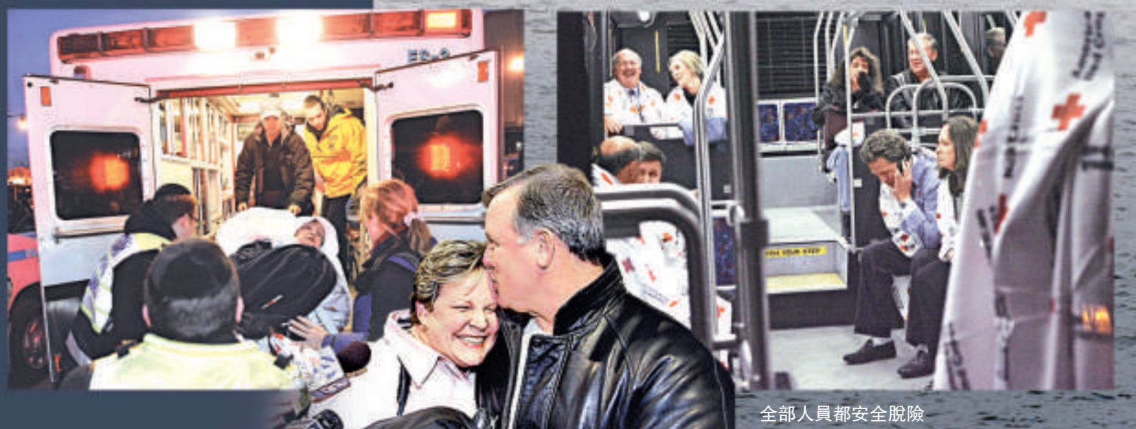
全部人員都安全脫險