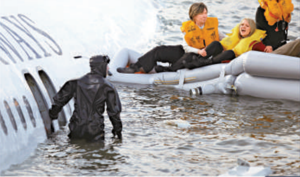
乘客剛剛被救出，驚魂未定

大約十五時三十六分，哈德遜河上的一艘渡輪趕到事發地點，船員們一邊拉乘客上船，一邊不斷向其他等待救援的乘客扔救生圈等救生設備。又過了六分鐘左右，機上人員已全部獲救。（新華社）