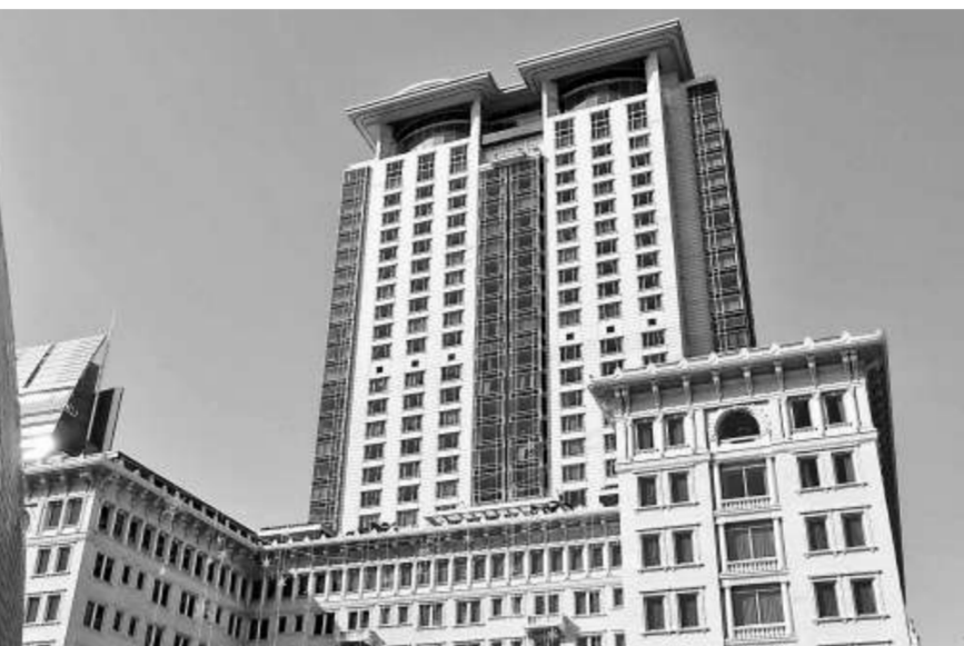
經歷八十年光景的半島酒店目睹香港變遷