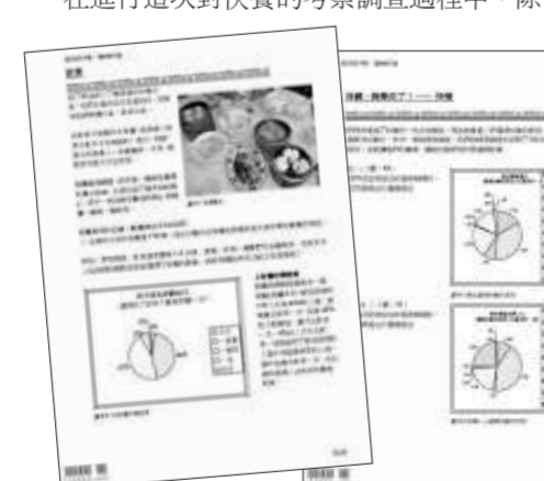
▲聖保祿中學研究報告《Speed Up》獲得第九屆消費文化報告獎高級組冠軍

除了學生最常用的問卷調查和實地考察之外，四位同學更多的是着重透過現象作出深入的思考。她們在報告中寫道：「現時社會上的普遍定律是有錢人用金錢換取時間，窮人用時間換取金錢。富有的人需要用錢去爭取更多的時間放在工作上或希望可以延長壽命；而窮人則需要長時間工作，以工作時間去賺取金錢。不過，快餐和這個定律背道而馳。因為，快餐除了是有名的快以外，更是十分便宜。因此，不論是有錢的人還是相對不富裕的人，也能透過購買快餐而換取時間。在時間和經濟效益的利誘下，很多人自然為了節省時間或金錢而選擇了快餐。」