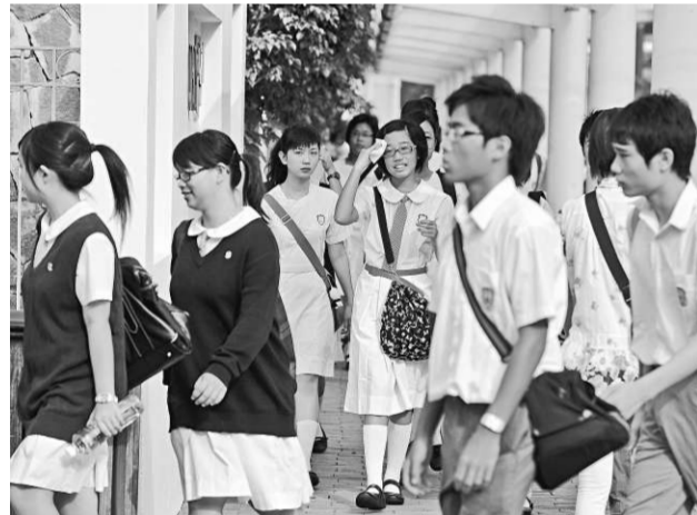
被告利用青少年同情心騙得財物