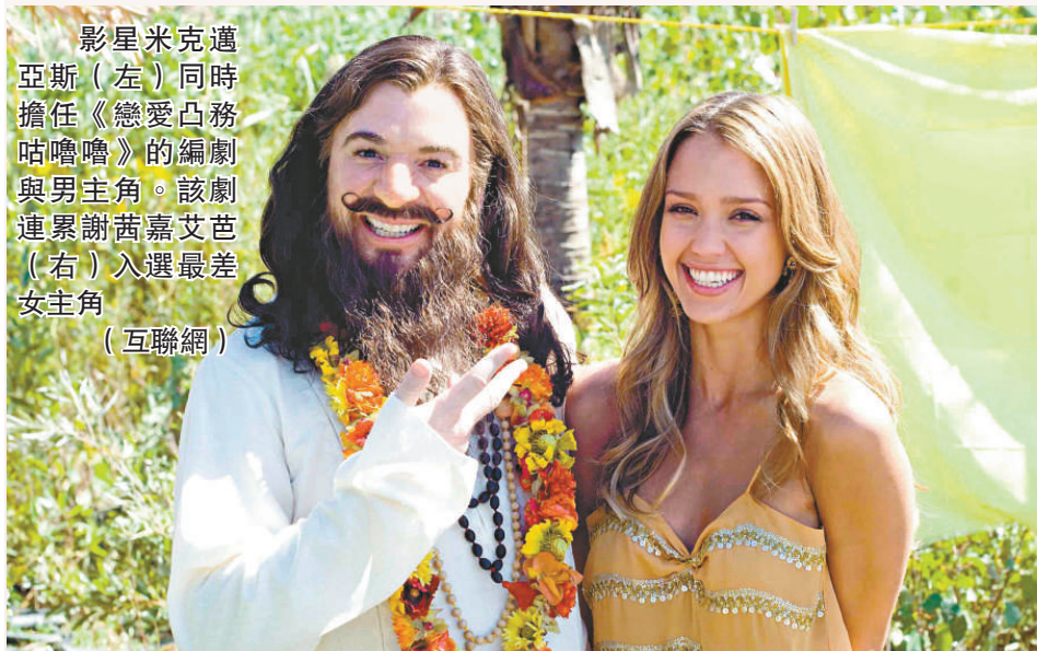
影星麥克邁亞斯（左）同時擔任《戀愛凸務咕嚕嚕》的編劇與男主角。該劇連累謝茜嘉艾芭（右）入選最差女主角

【本報訊】綜合媒體二十二日消息：以嘲諷荷里活爛片為題的金草莓獎今天宣布入圍名單。今屆的「大贏家」是獲得六項提名的《戀愛凸務咕嚕嚕》（The Love Guru），而「名門獄女」芭莉絲希爾頓則是唯一獲兩項提名的演員，與性感女神謝茜嘉艾芭雙雙入圍最差女主角。