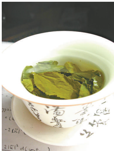
▲研究顯示喝茶有效預防乳癌

五十歲以下婦女若每天喝至少三杯茶，其患癌機會下降約百分之三十七。但年紀更大的婦女喝同等量的茶，卻看不出有特別益處。研究人員相信，茶中所含的抗癌物質可能具有更大潛力防止年輕婦女生癌。