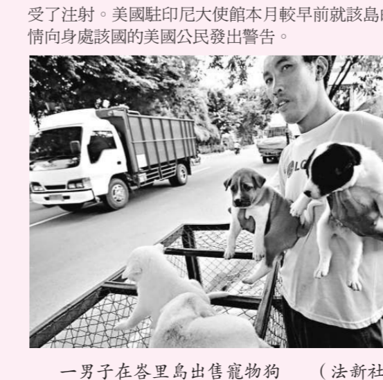
一男子在峇里島出售寵物狗

印尼旅遊勝地峇里島 (又稱巴厘島) 去年十一月爆發狂犬病，至今導致四人喪生，省政府即將為全島的寵物狗注射預防疫苗，以免旅遊業受影響。前幾宗感染個案發生於首府登巴薩和巴塘，而當局將首先於二十四日出動約三百名官員到登巴薩進行注射，以免當地病毒蔓延至其他地區。峇里至今已有一萬四千四百一十七條寵物狗和一千零五十一條流浪狗接受了注射。美國駐印尼大使館本月較早前就該島的疫情向身處該國的美國公民發出警告。