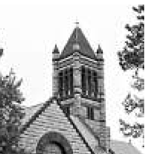
▲哈佛大學法學院大樓的部分樓層臨時被關閉