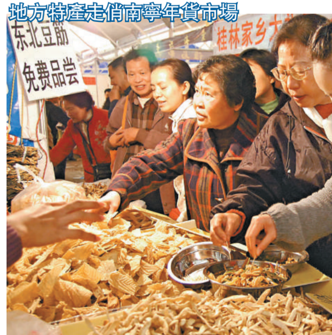
臨近春節，廣西南寧市各大年貨市場進入購物的高峰階段，來自全國各地的土特產受到人們的青睞。圖為 21 日，南寧市民在選購東北豆腐。

等議題深入交換了意見。哥斯達黎加是中國在中美洲的第二大貿易夥伴，同時中國也是哥第二大貿易夥伴。近年來，中哥雙邊貿易發展迅速，據中國海關統計，2007 年雙邊貿易額為 28.7 億美元，是 2001 年雙邊貿易額的 32 倍。