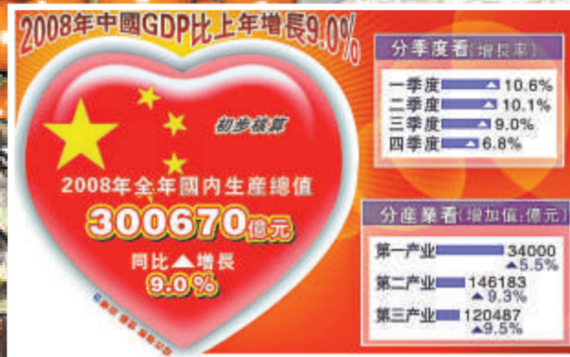
2008 年中國 GDP 比上年增長 9%