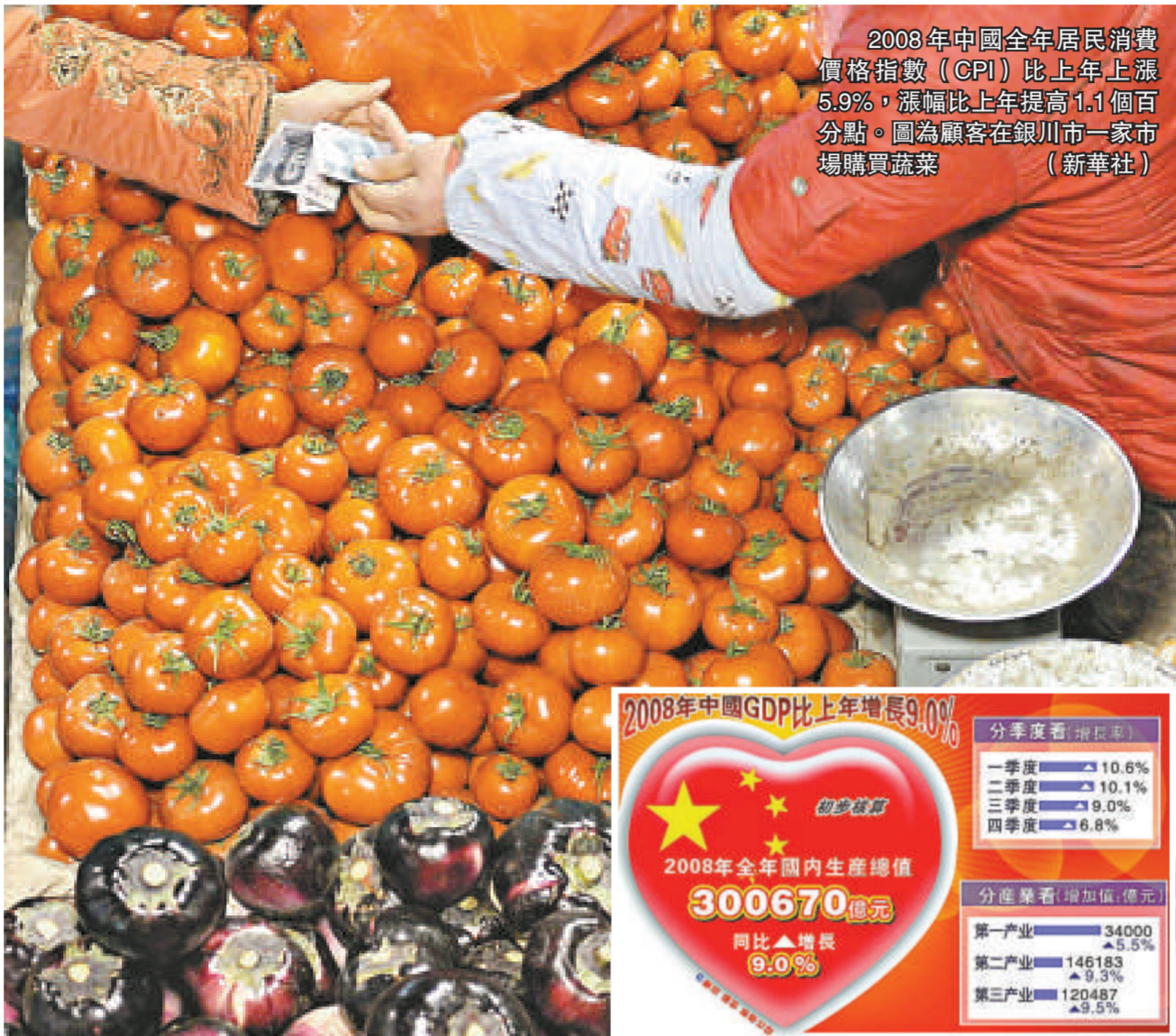
2008 年中國全年居民消費價格指數 (CPI) 比上年上漲 5.9%，漲幅比上年提高 1.1 個百分點。圖為顧客在銀川市一家市場購買蔬菜

馬建堂表示，他對 2009 年的中國經濟、對未來的中國經濟充滿信心。而對於 2009 年中國經濟能否「保八」的問題，馬建堂最後給出了肯定的回答：「今年只要做好宏調經濟措施、擴大內需、增加投資，一定可以「保八」。」