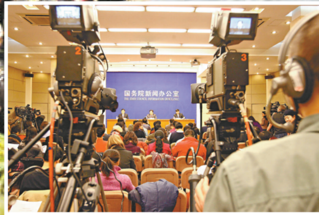
22 日，國家統計局局長馬建堂在國務院新聞辦介紹 2008 年國民經濟運行情況