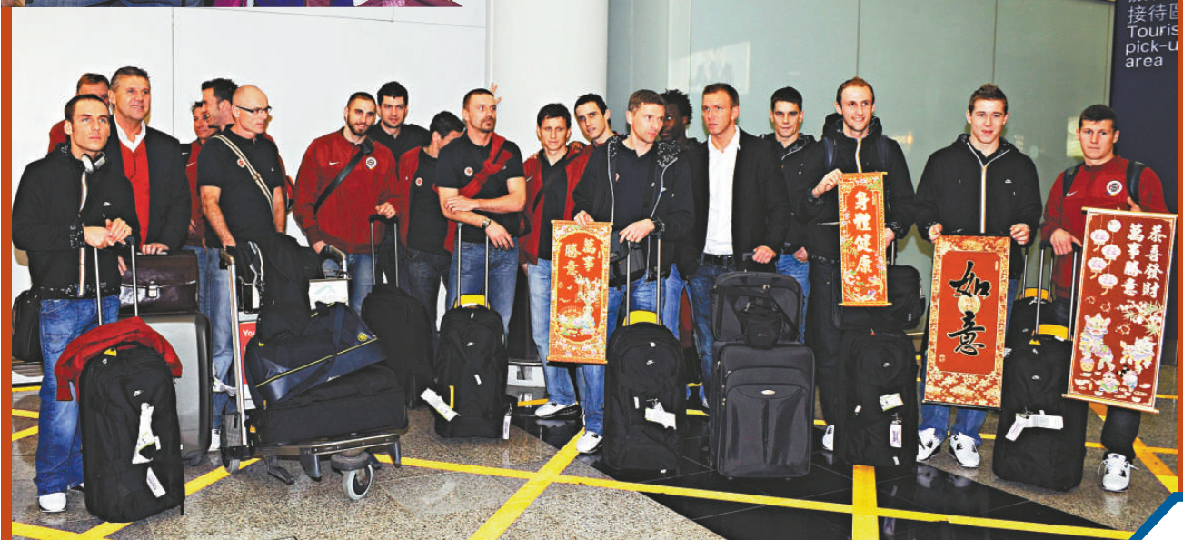
▲捷克布拉格斯巴達隊昨晚抵港