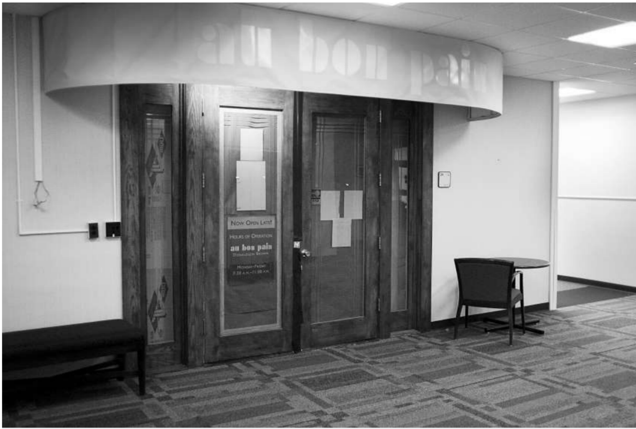
▲發生兇殺案的研究生生活中心餐館依然關閉

警方說，校方關注在校學生、特別是中國學生的生活，已安排心理輔導人員在研究生生活中心向學生和教職員工提供必要幫助。校方說，校內其他中國學生目前情況良好。