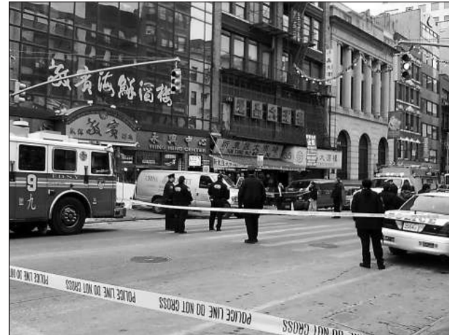
警察封鎖了車禍現場