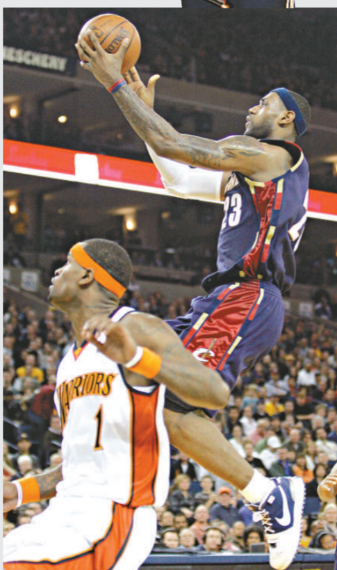
勒邦占士(右)以一人之力協助騎士贏波

火箭已經有麥基迪及艾迪斯兩名主力因傷缺陣，幸好姚明傷勢不重，經X光檢查，姚明的右膝部骨頭未見異常。他說：「這次膝傷是膝蓋與膝蓋碰撞所致，實際上此傷並不是今天才出現的，過去10場比賽裡，那個受傷部位受到多次衝擊。」姚明已經進入了球隊的每日觀察名單，意味著姚明最快可以在周日復出。