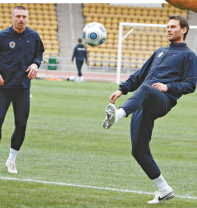
布拉格斯拉達的貝加