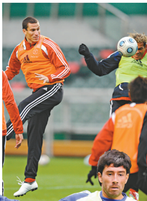
巴西前鋒卡卡(左)將是南華飛馬隊的「秘密武器」

【本報訊】2009年賀歲杯足球賽明午在香港大球場開戰，今屆比賽是近20年來首次有2支香港球隊(港聯及南華飛馬)在大年初一交手，加上2隊高層陣前「牙散戰」，令賽事更添話題性。南華飛馬隊已準備在明午之戰留力，領隊羅傑承更表示球隊對港聯無「落足料」，而港聯領隊也不甘示弱，將正選陣容保密，務求令對手「無法捉路」。