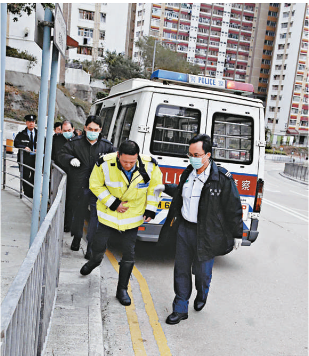
被撞警車上三名警員受輕傷，需送院敷藥