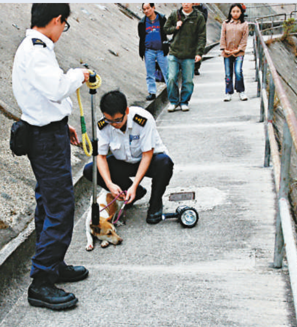
消防員利用繩索救出墮沙井唐狗

獲救雌性唐狗約一至兩歲，健康狀況良好，已送往愛護動物協會檢驗；現等待狗主認領，無人認領則另作安排。現場在慈雲山慈愛苑愛華閣對開二十米高山坡，昨日下午四時許，一隻雌性唐狗被被困於一條深三米引水道沙井內，居民聽聞哀鳴聲發現該犬後報警。警方和消防人員趕至，愛護動物協會人員亦協助救援，利用繩索將狗隻扯回地面脫險，由於牠腳部擦傷及受驚，需用擔架綁好後抬落山，送往愛護動物協會接受檢驗。