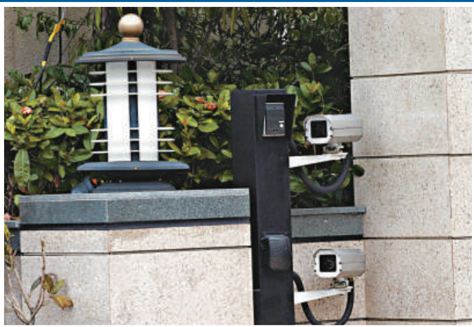
屋苑大門有電閘和保安員駐守，四周有閉路電視系統監測防盜