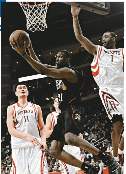
▲76人前鋒T楊格(中)在火箭姚明(左)與麥基迪之間突圍上籃。

黃蜂在主场延續強勢，以94:81擊退金塊。雖然黃蜂仍有大衛韋斯和贊特拿缺陣，但史杜真高域今仗有神勇表現，全場貢獻了最高的26分，基斯羅羅在控球後衛對決中力壓金塊比立斯，前者取得12分和10次助攻，後者有12分和2次助攻，結果黃蜂終止了金塊3連勝的紀錄。