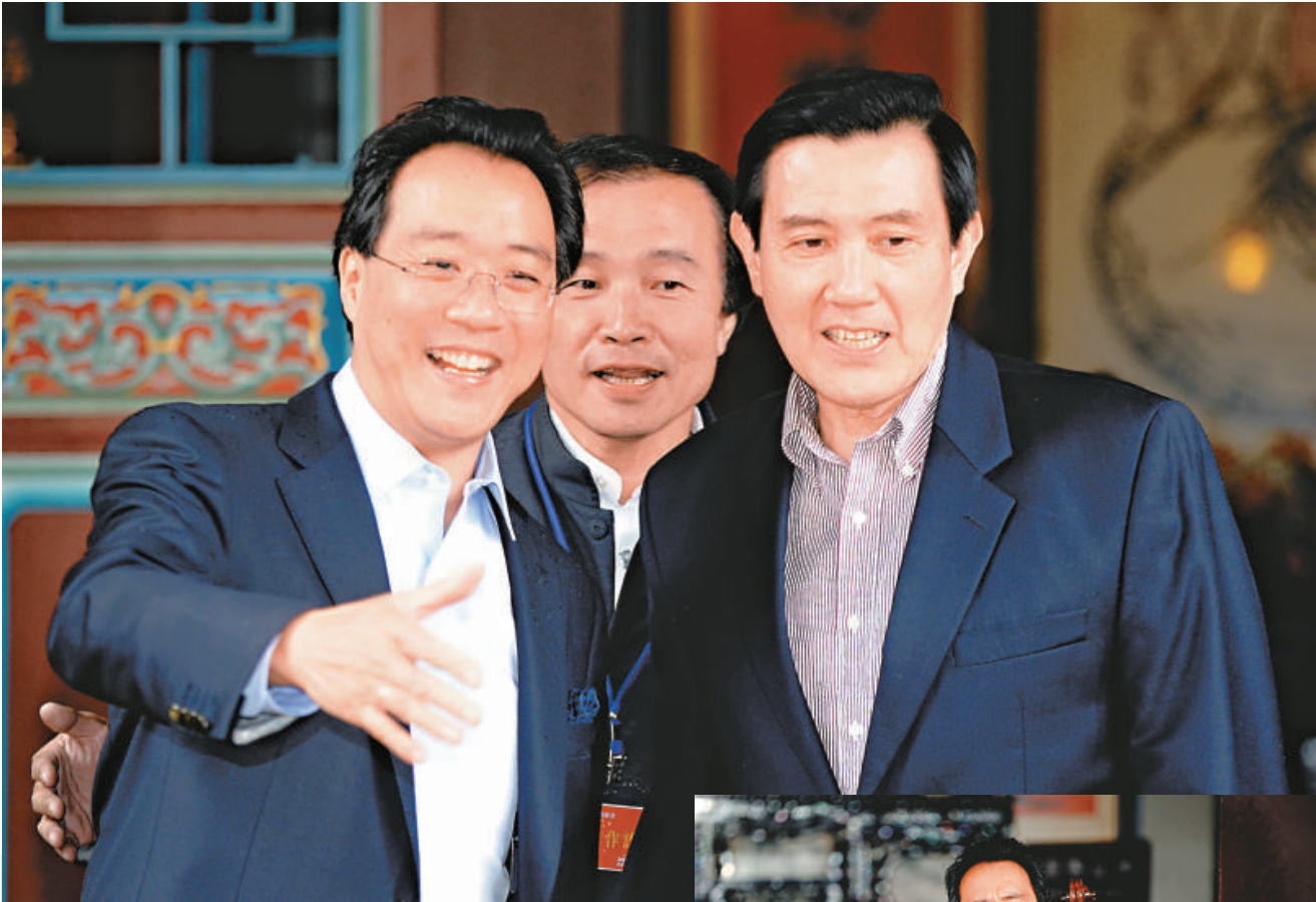
▲睽違10年後，「雙馬會」昨日在板橋林家花園舉行，馬英九（右）期許華裔大提琴家馬友友。

「國家音樂廳」內座無虛席，現場同步在兩廳院廣場進行戶外實況轉播；台北今晚下着濛濛細雨，不過，隨著音樂會的開始，雨勢漸歇，兩廳院廣場上聚集愈來愈多民衆，數百位民衆或自備椅子、或席地而坐，不畏天氣寒冷，共同參與這場音樂饗宴。