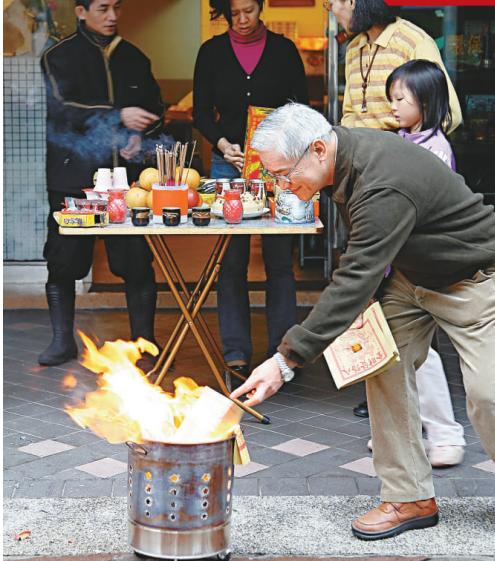
台灣許多公司、行號在昨日大年初五開工迎財神，衆人焚香祈求一整年財運亨通。