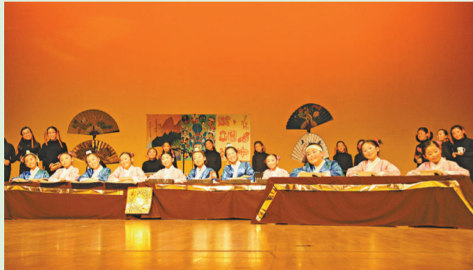
《課室嘉年華》將軍澳天主教小學演出