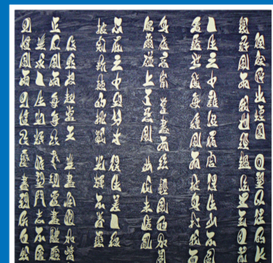
展品中亦包括流行歌詞