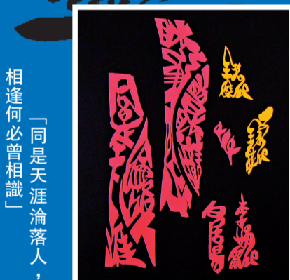
「同是天涯淪落人，相逢何必曾相識」