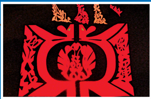
這個「北京奧運」四個字的造型經過精心設計