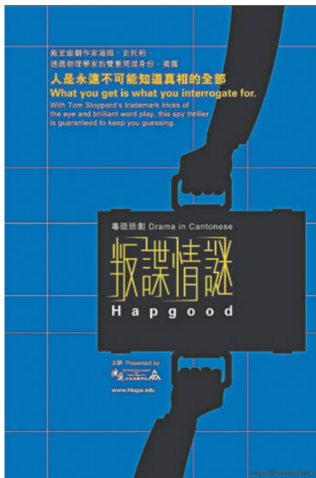
演藝學生將演出《叛謀情謎》

《叛謀情謎》將於二月二十三日至二十八日晚上七時四十五分，及二月二十八日下午二時四十五分在演藝實驗劇場上演。全劇以粵語演出，適合十二歲或以上人士觀看。門票於快達售票發售。