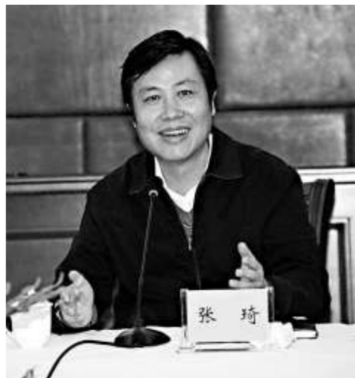
儋州副書記、代理市長張琦

儋州古稱儋耳郡，建制於公元前110年係中原文化傳入海南的「橋頭堡」。文化風向源遠流長，宋代以來，吟詩作對的風氣盛行民間，調聲