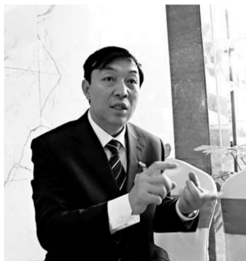
敦煌市委書記孫玉龍介紹「藝術之都」建設理念

他說：「我們將以「魅力敦煌，藝術之都」為目標，建設富裕民主文明和諧的國際旅遊名城。一如既往地以保護敦煌文化資源為己任，並着力推動文化藝術的進步，實現文化藝術的創新。我們正積極做好《敦煌城市總體規劃》、《敦煌藝術產業開發區規劃》、《敦煌生態環境與文化遺產保護方案》、《陽關文化旅遊規劃》、《玉門關保護利用規劃》的編制、陽關遺址及漢長城烽燧遺址維修保護等項目工作和國家級非物質文化遺產項目——敦煌曲子戲的保護挖掘。我們對興辦文化旅遊項目，在選址、申報、立項、審批等方面優惠優先。對文化產品開發、文物保護開發、民俗工藝品挖掘、中小型文化旅遊企業創業都予以大力扶持。」