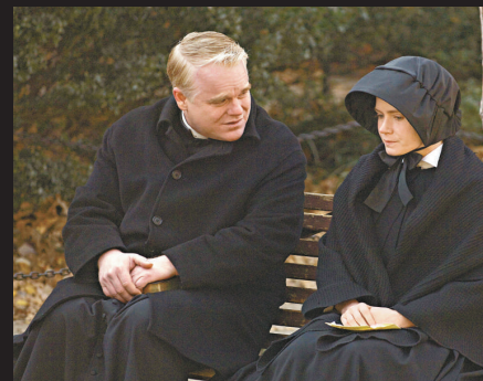
▲《聖訴》獲奧斯卡五項提名，實力超群