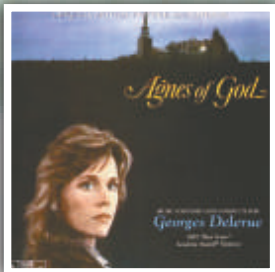
▲《神蹟奇案》改編自百老匯名劇