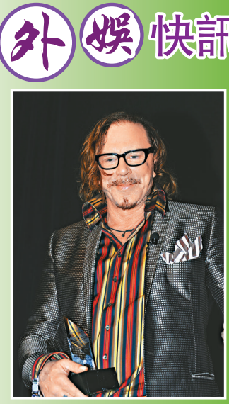
洛基近來人氣急升