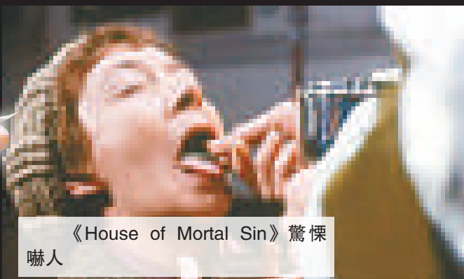
《House of Mortal Sin》驚悚嚇人