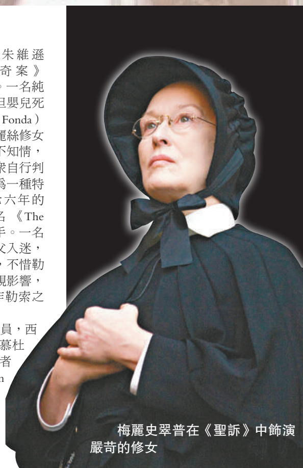
梅麗史翠普在《聖訴》中飾演嚴苛的修女