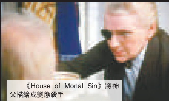
《House of Mortal Sin》將神父描繪成變態殺手