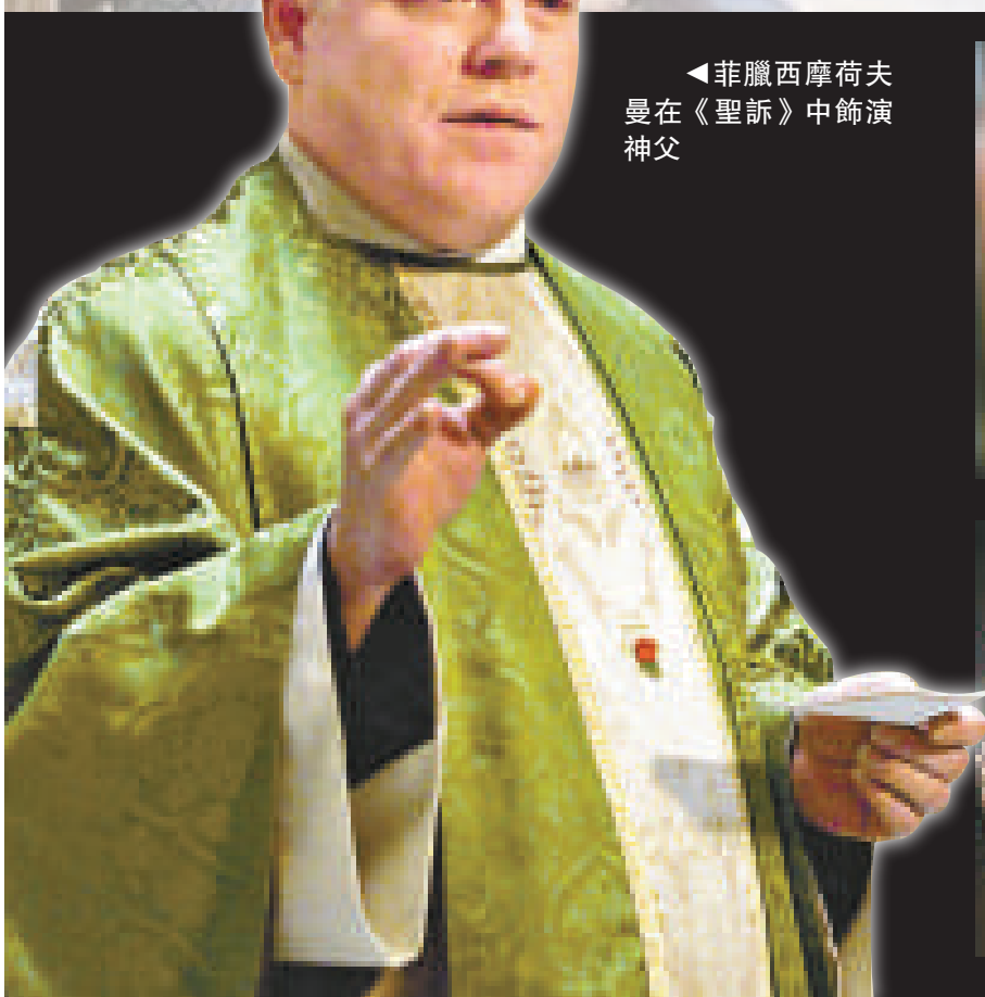
▲菲臘西摩荷夫曼在《聖訴》中飾演神父