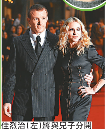
佳烈治（左）將與兒子分開