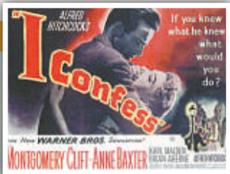
▲《懺情記》為希治閣的作品