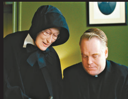
▲梅麗史翠普（左）及荷夫曼在《聖訴》中鬥好戲