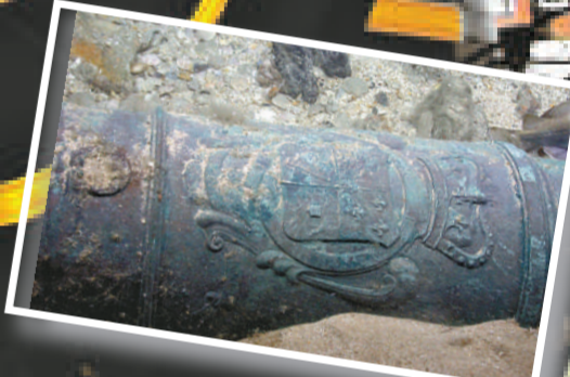
▲「勝利號」的其中一支銅炮