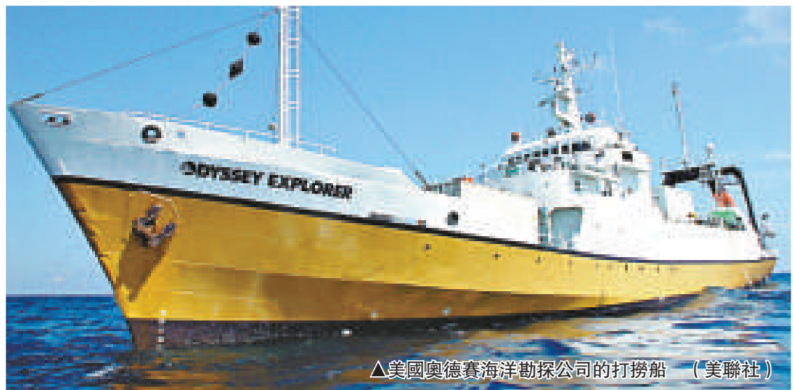
▲美國奧德賽海洋勘探公司的打撈船

【本報訊】綜合媒體佛羅里達州·坦帕二日消息：美國奧德賽海洋勘探公司周一在倫敦宣布，他們在英倫海峽發現一艘沉睡在海底二百六十多年的英國木製戰船「勝利號」，估計船上可能載有價值數億美元的財寶。由於這是屬於英國的戰船遺物，雙方勢釀一場寶藏爭奪戰。