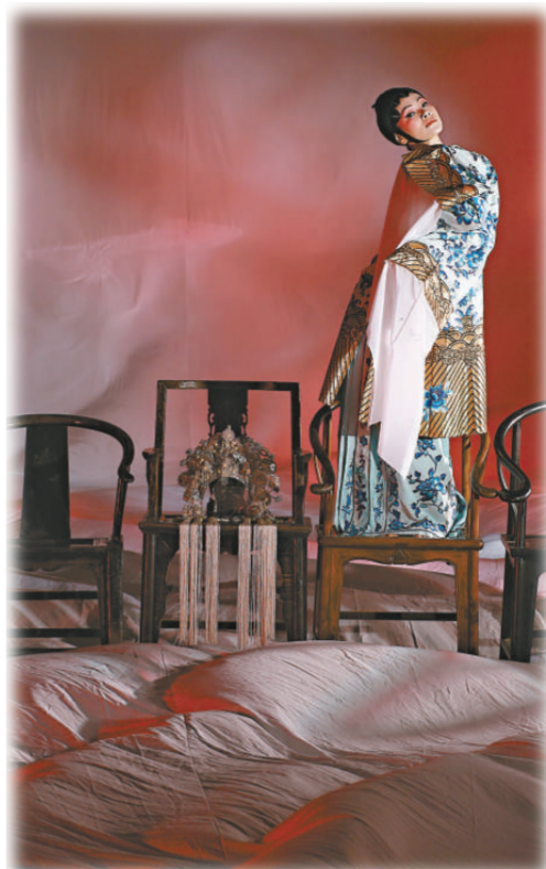
舞劇《帝女花》既保留傳統又有新意