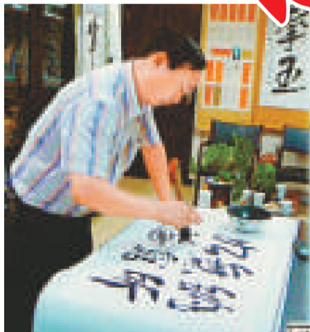
▲楊明示範書法，牆上「拳王」二字是贈送給第二十九屆奧運會拳擊冠軍貴州選手鄒市明的書法作品

古往今來，中華書法是中華民族傳統文化的瑰寶。書法家創造的書法藝術，千姿百態，無奇不有。筷子，是我們飲食工具中最常用的，今天，書法家楊明將筷子作爲書法工具來抒情言志，描繪人生百態，傳承中華文化。