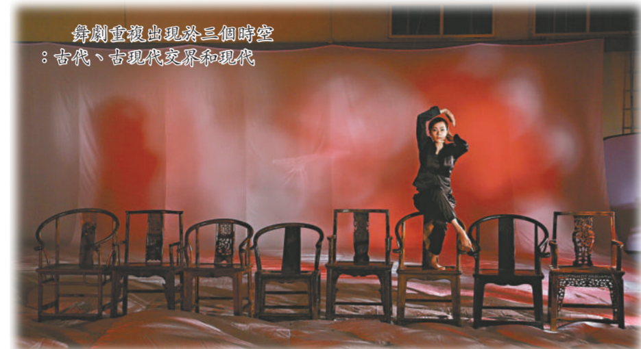
舞劇重演出現於三個時空：古代、古現代交界和現代

三月廿一日下午四時半至六時的「後台之旅」，則會由文通領參加者參觀《帝女花》的舞台、後台、服裝間，解構舞台及服裝設計概念。報名及查詢：31031806。