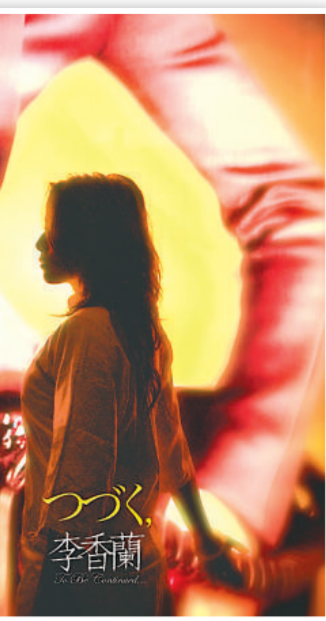
李香蘭是一個傳奇人物，浪人劇場將演出《つづく，李香蘭》