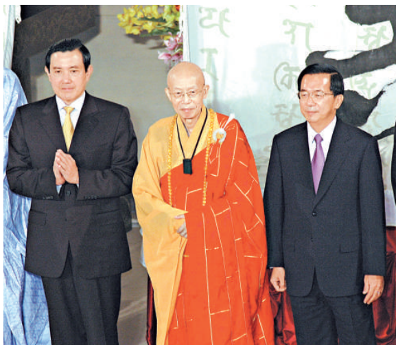
2005年10月21日法鼓山開山大典，在聖嚴法師的安排下，當時是台北市長的馬英九與台灣的「前總統」陳水扁同台合照（資料圖片）

台灣的「總統府」指出，聖嚴法師過去與「總統」馬英九多次深度互動，給予諸多開示、鼓勵與支持，「總統」聞訊深表震驚與悲痛。馬英九也在晚間趕往法鼓山致哀。