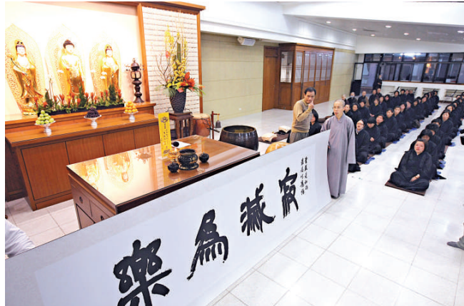
台北農禪寺的僧眾與信徒3日晚在佛堂參加念佛報恩法會緬懷聖嚴法師